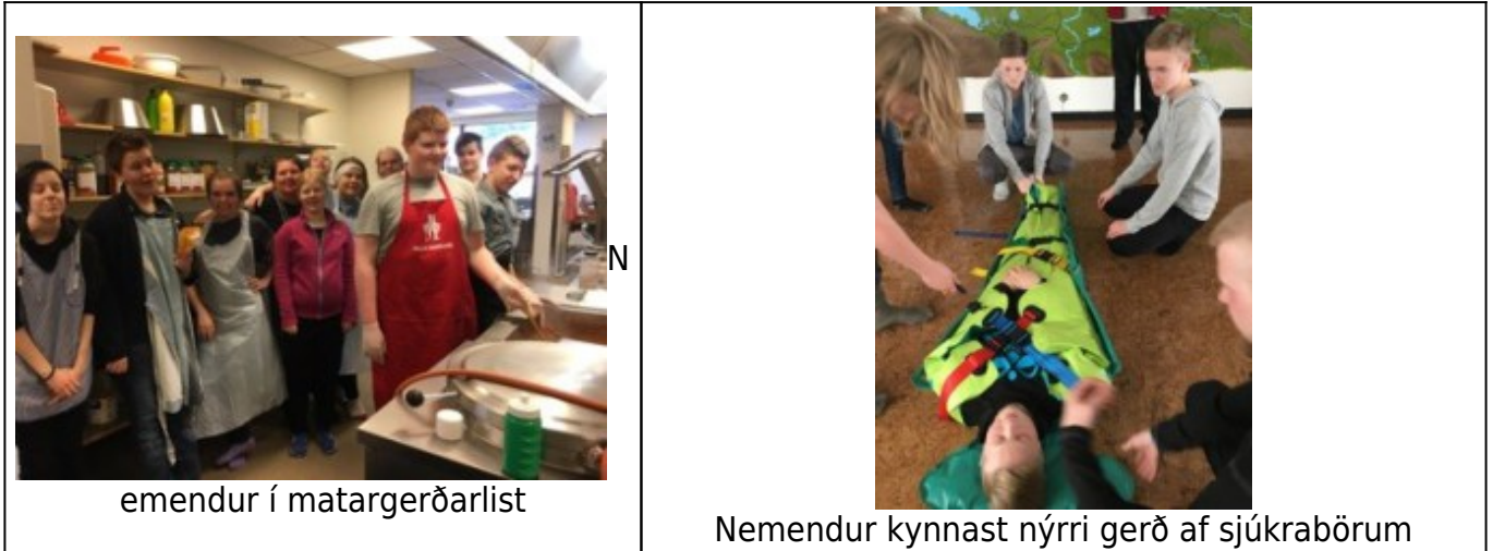
emendur í matargerðarlist