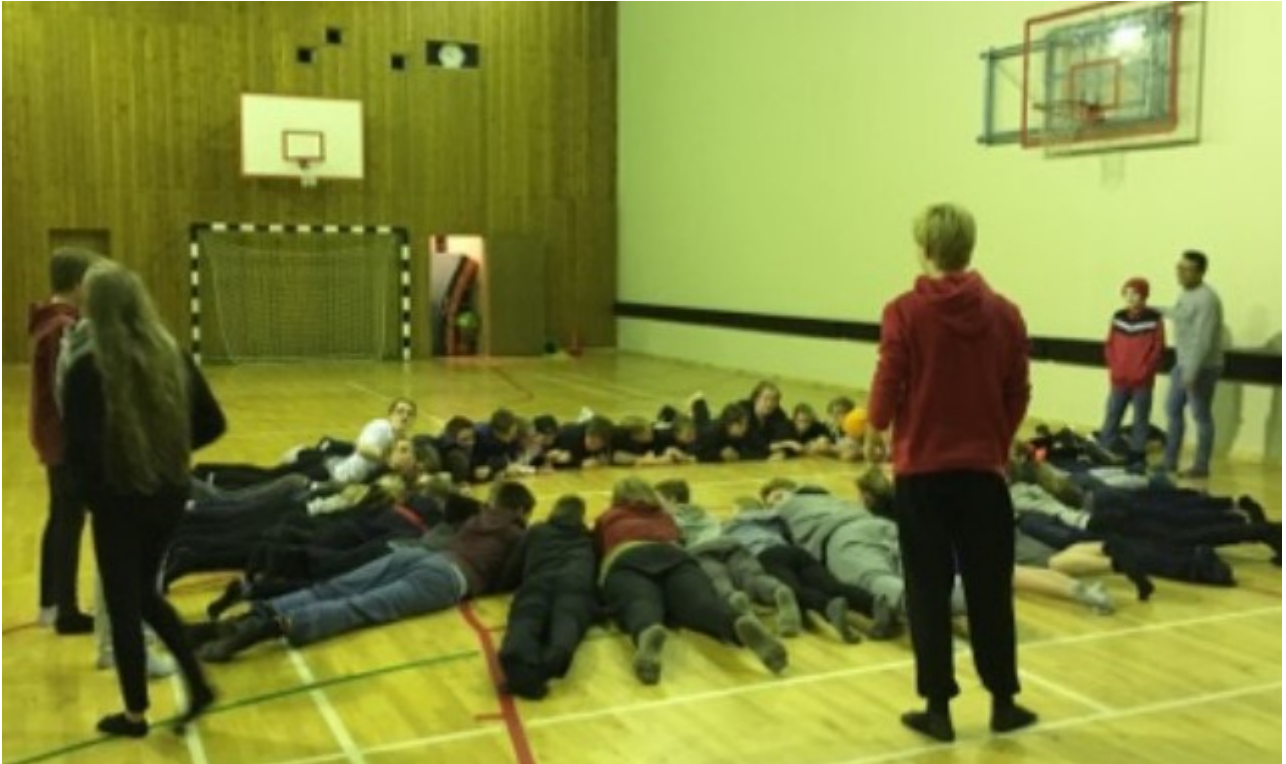
BRUGÐIÐ Á LEIK Í LOK DAGS ÞAR SEM NEMENDUR SJÁ UM SKIPULAG

Hér má sjá lista yfir allar smiðjur sem hafa verið í boði: