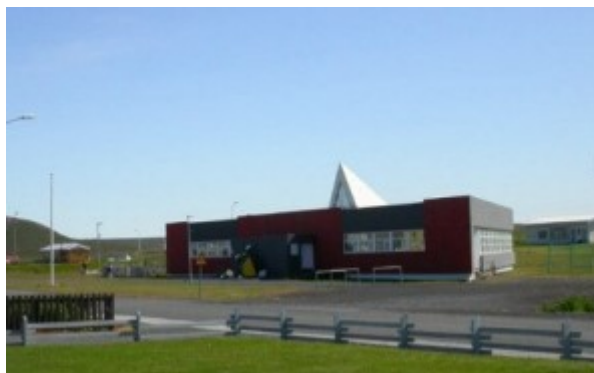
Mynd 1 - Skólahúsið á Kópaskeri.

Eins og fram hefur komið tók verkefnið mig tvö skólaár í heild og ég fylgdist alls með eitthvað á annað þúsund kennslustundum. Ég fylgdist yfirleitt með tveimur bekkjardeildum í hverjum skóla, en einni í fámennu skólunum og var því hálfan mánuð á Kópaskeri. Athugunum var hagað þannig að ég sat í kennslustundum eða öðrum námslotum og fylgdist með og skráði hjá mér það sem fyrir augu og eyru bar af miklu kappi. Stílabókin sem ég skrifaði í heimsókninni á Kópasker taldi, þegar upp var staðið, 74 þéttskrifaðar síður - athuganir mínar og athugasemdir. Það reyndist oft nokkuð snúnara að fylgjast með kennslu í Grunnskólanum á Kópaskeri, en víðast annars staðar, þar sem nemendur gátu oft verið að læra út um allan skóla.