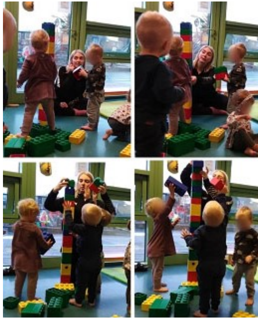
BÖRNIN STUDD Í SAMSKIPUM OG LEIK.

Hér verður fjallað um niðurstöður starfendarannsóknarinnar með hliðsjón af rannsóknarspurningum og dregin fram dæmi úr gögnunum til að gefa skýrari mynd af því sem kom fram í ferlinu. Kaflanum er skipt niður eftir þremur meginþemum; stuðningur námsumhverfis við samskipti ungra barna, stuðningur kennara við leik og samskipti ungra barna og samskipti barnanna í ærslaleik.