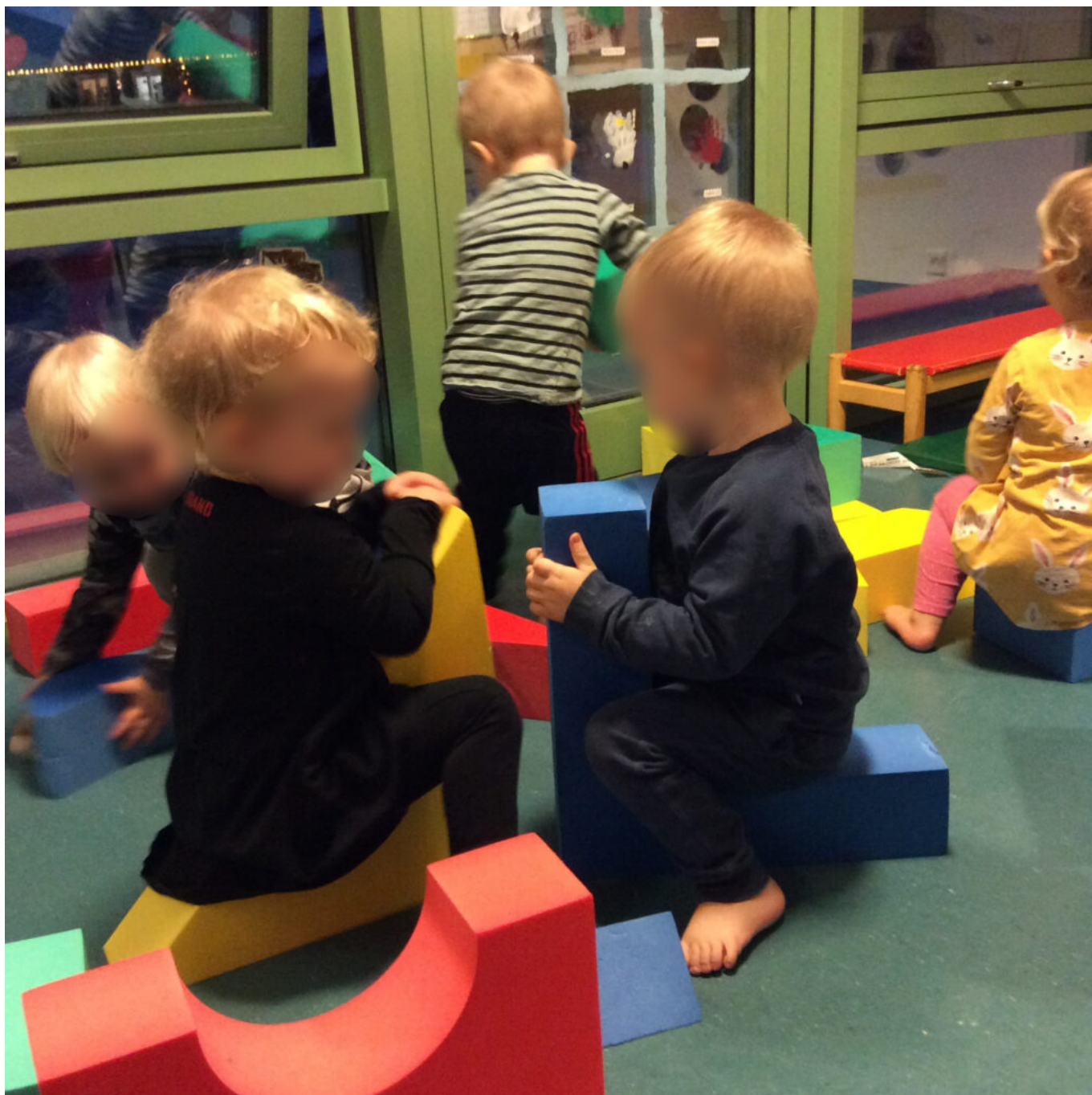
LEIKIÐ MEÐ SVAMPKUBBA.