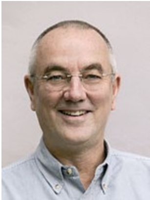
Mynd 1 Guy Claxton.

Hugmyndafræðingur kenningarinnar um námskraftinn (learning power approach) er Guy Claxton (2018; 2002; Glaxton og Powell 2019), enskur sálfræðingur og menntunarfræðingur. Hugmyndafræðin er kynnt á heimasíðu samtakanna Building Learning Power (2022) og þangað er hægt að sækja ítarefni um námskraftinn bæði fyrir framhaldsskóla og grunnskóla.