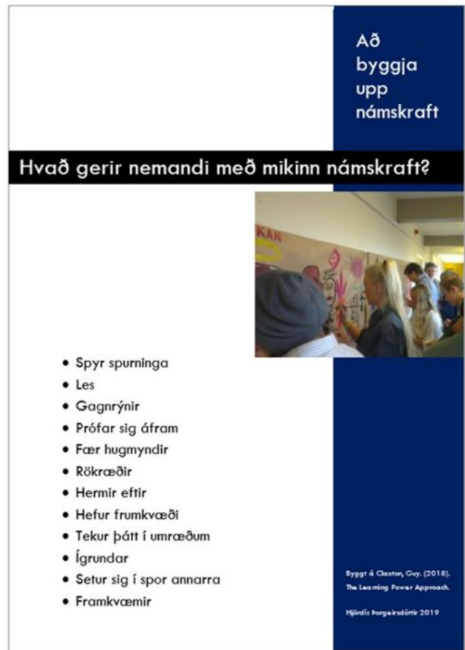
MYND 4-7 VEGGSPJÖLD UM NÁMSKRAFT NEMENDA.