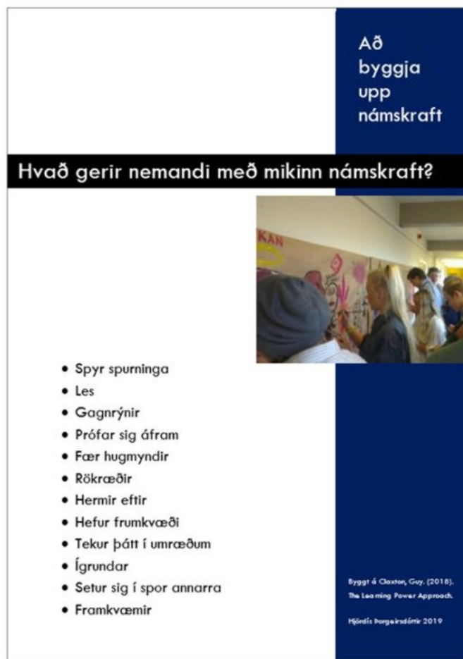
Mynd 4-7 Veggspjöld um námskraft nemenda.