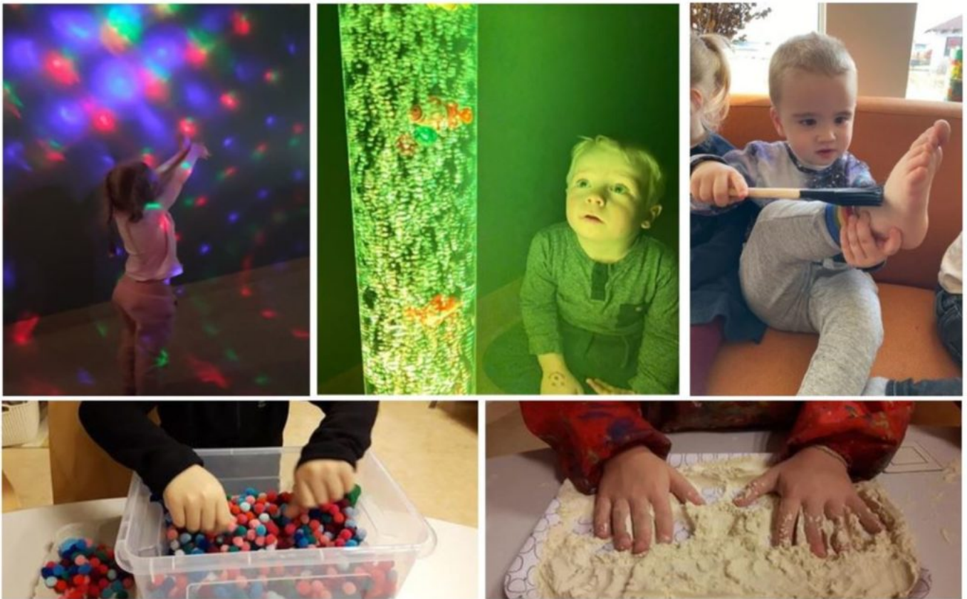
BÖRNIN NJÓTA SÍN Í SKYNNUNARRÝMI LEIKSKÓLANS.

Í tengslum við ferðina til Póllands kom upp hugmynd að fá dýr til liðs við okkur til að örva skynjun barna. Fyrir valinu varð hundurinn Veca, Ungversk vizsla, sem er í eigu kennara skólans. Veca fór í gegnum viðurkennt mat hjá Rauða krossi Íslands og heimsækir nú reglulega börnin í Gefnarborg og fer með þeim í vettvangsferðir. Það er margt sem börnin læra og njóta góðs af í heimsóknum Vecu þar sem hundar örva flest skynfæri. Börnin fá að snerta Vecu og velta fyrir sér ýmsum spurningum. Hvernig er að koma við feldinn? Er hann mjúkur eða harður, kaldur eða heitur? Er öðruvísi að koma við feldinn eða eyrun? Hvernig líður Vecu? Er hún glöð eða leið? Hvernig er lyktin af Vecu? Heyrist hljóð í henni? Hvernig er hún á litinn o.s.frv. Börnin fá að njóta nærveru við hund. Þau sem eru hrædd við hunda fá tækifæri til að komast yfir hræðsluna. Þau læra að bera virðingu fyrir dýrum og hvernig eigi að haga sér á öruggan og viðeigandi hátt í kringum hunda.