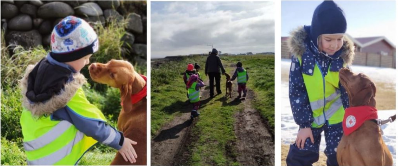
BÖRNIN NJÓTA SAMVISTAR MEÐ VECU.