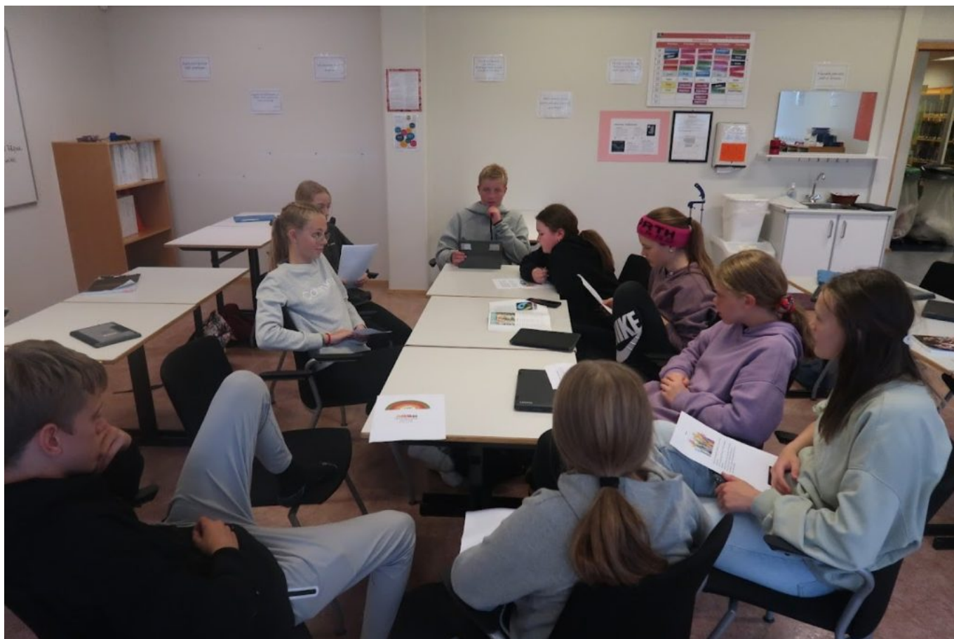
Mynd 5 - Í Draumalandinu var lögð mikil áhersla á að nemendur þjálfuðust í að tjá sig og hlusta af virðingu hvert á annað.