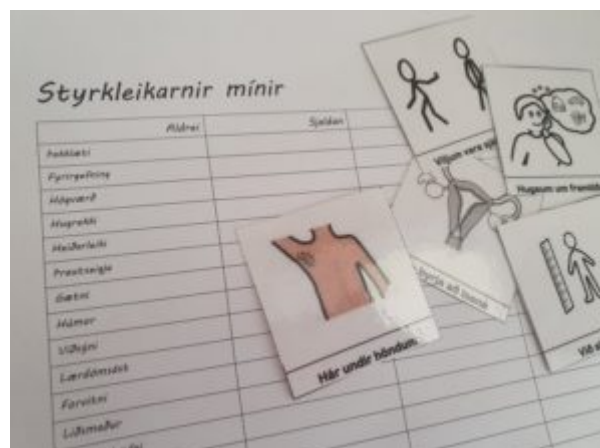
STYRKLEIKAVINNA AUK FERLISPJALDA Í KYNÞROSKAFRÆÐSLU, NOTAÐ Á MIÐSTIGI. STYRKLEIKAVINNAN HEFUR FALIST Í ÞVÍ AÐ NEMENDUR META STYRKLEIKA SÍNA Á MISMUNANDI SVIÐUM EN

Í framtíðinni vona ég svo innilega að kynfræðsla verði sjálfsagður þáttur í skólastarfi, til viðbótar við þá fræðslu sem skólahjúkrunarfræðingar veita, en ekki afgangsstærð sem er bjargað fyrir horn með þemadögum og tilviljanakenndum plástrum. Til þess þarf vilja, ekki bara kennara til að kenna fagið, heldur líka vilja skólayfirvalda á öllu landinu til að standa vörð um kynfræðsluna. Verkefnið Við er eitt af vörðunum í átt að slíku skólasamfélagi.