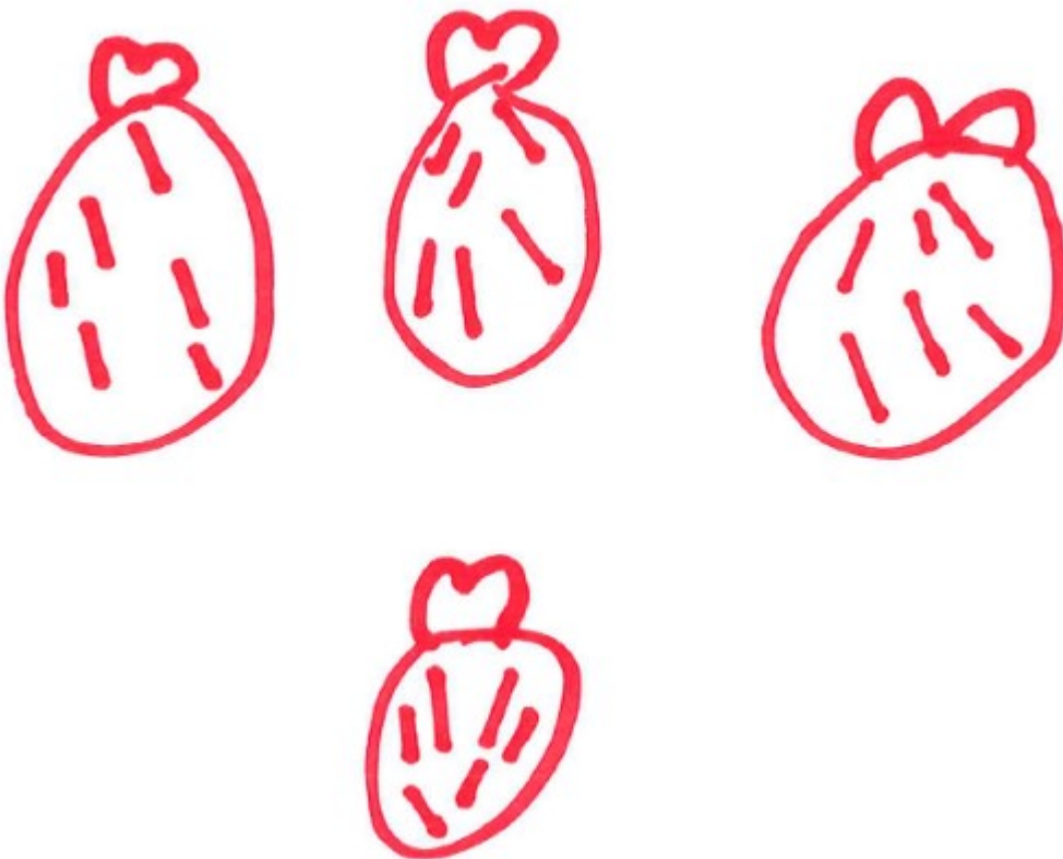
Mynd 2: Líkan Iðunnar

Iðunn leysir þrautina einnig með því gera sér hlutbundið líkan, en hún velur að teikna mynd. Hún byrjar á því að teikna einn poka og teiknar inn í hann 6 strik sem tákn fyrir gulrætur. Hún teiknar svo hina pokana á sama hátt, einn poka í einu (sjá mynd 2). Til að finna heildarfjöldann telur hún gulræturnar í fyrstu tveimur pokunum, stoppar og telur svo fjöldann í hinum tveimur pokunum. Þegar hún er beðin um að lýsa lausnarleið sinni segir hún „Hér eru 12 [bendir á 2 poka] og þetta hér eru 12 [bendir á hina 2 pokana] og 12 plús 12 eru 24.”