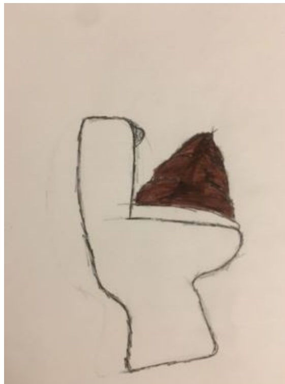
MYND 8. SKÓLAKLÓSETT.