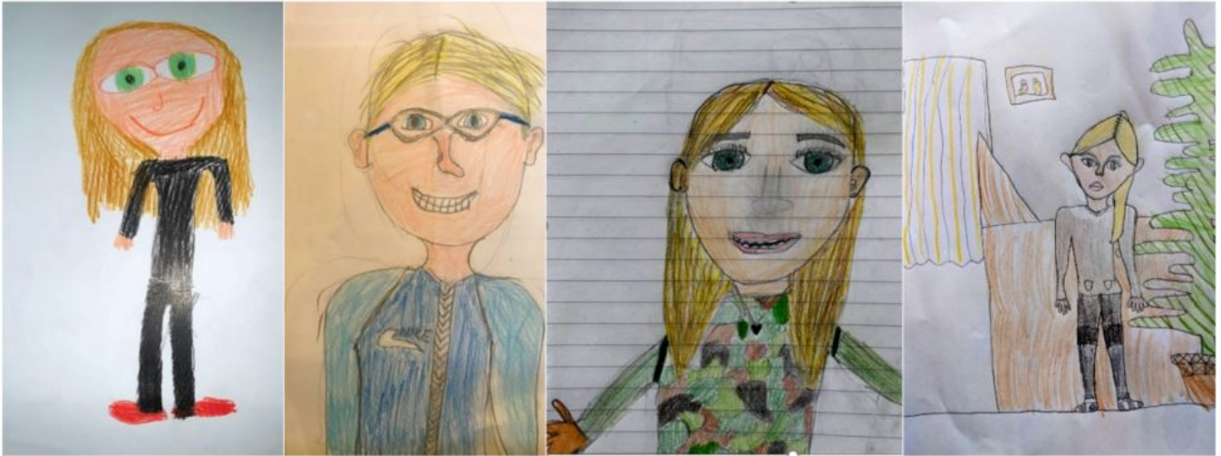
MYND 5. SJÁLFSMYNDIR. GRUNNSKÓLANEMENDUR.MATUR OG ÖRYGGI

Nemendurnir töldu mikilvægt að maturinn í skólanum væri góður. Einn nemandi skrifaði: „Maturinn þarf að vera ætílegur þá er auðveldara að læra og gera allt“. Dæmi um önnur svör sem snéru að mat eru eftirfarandi: