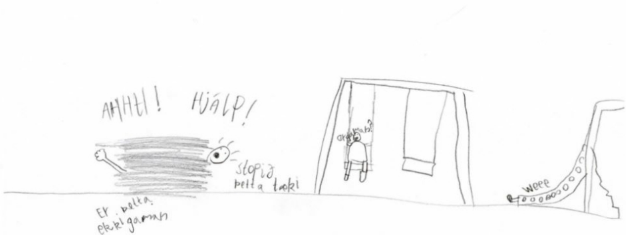
MYND 3. FRÍMÍNÚTUR.

Í þessu samhengi nefndu nemendurnir einnig áhrif bekkjarstærðar á skólastarfið eða eins og einn nemandinn orðaði það: „Ekki of stór bekkur. Heldur ekki of fáir“. Nemendahópurinn þarf að vera mátulegur bæði í samhengi við nám og félagstengsl.