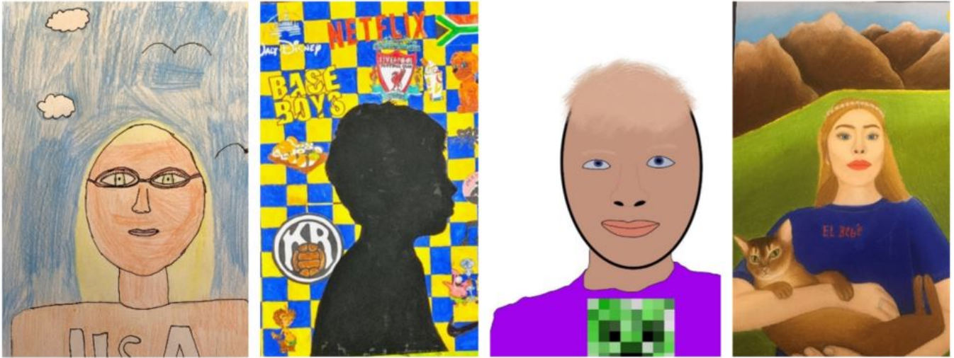
MYND 7. SJÁLFSMYNDIR. GRUNNSKÓLANEMENDUR.