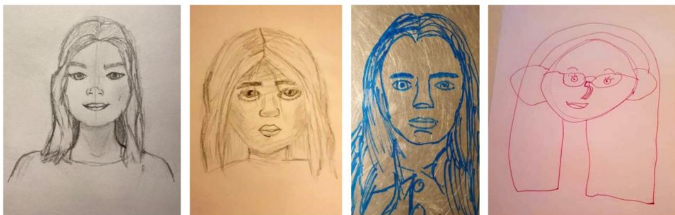
MYND 1. SJÁLFSMYNDIR. GRUNNSKÓLANEMENDUR.

væri sem gerði skóla góða en öll tilheyrðu þau skólum þar sem nemendahópurinn var margbreytilegur.