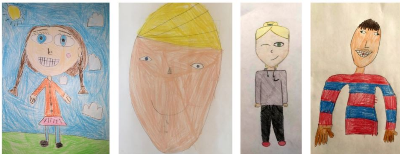
MYND 9. SJÁLFSMYNDIR. GRUNNSKÓLANEMENDUR.

Þegar öllu er á botninn hvolft þá höfðu krakkarnir rétt fyrir sér að skólaklósett eru mikilvægur þáttur í umræðunni um skóla margbreytileikans. Til frekari glöggvunar um aðgengi, öryggi og salernisaðstöðu vil ég benda lesendum á heimasíðu verkefnisins Around the toilet ( https://aroundthetoilet.wordpress.com ) en þar má finna gagnleg myndbönd og