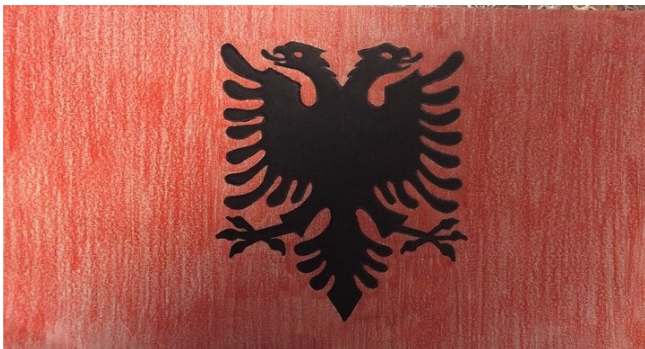
MYND 4 FÁNI ALBANÍU - TEIKNING NEMANDA

Meginniðurstöður gagnaöflunarinnar gáfu til kynna að nemendur hefðu verið sáttir við verkefnið og væru að flestu leyti jákvæðir í garð þess. Í heild voru þeir bæði áhuga- og vinnusamir. Nokkrir hópar áttu vissulega erfitt með að vinna saman; persónuleiki og vinnusemi fóru ekki alltaf saman og skapaði það ágreining, en það kom á óvart þegar kynning verkefnanna fór fram í lokin, að þeir hópar sem áttu hvað erfiðust samskipti lögðu sig fram við að gera kynningu sína flotta. Auk þess reyndust allir nemendur fróðir um sín lönd og gátu bæði svarað opnum spurningum sem ég lagði fyrir þá og aukaspurningum sem mér flugu í hug á staðnum.