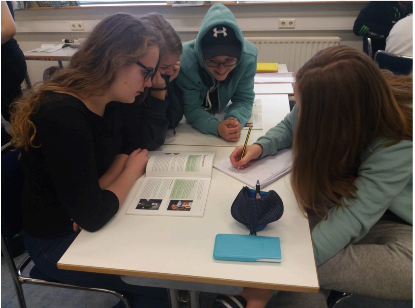
NEMENDUR Í 10. BEKK Í GRUNNSKÓLANUM Á HELLU UNDIRBÚA TILRAUN MEÐ HLIÐSJÓN AF EFNISHEIMINUM, BÓK HAFÞÓRS

ég. Og víst er að þegar ég rýni í textabrotið hér að framan á ég ekki í neinum vandræðum með að ljá því merkingu. Þess er auðvitað að vænta þar sem ég er höfundurinn. En hvernig? Hvernig fer ég að?