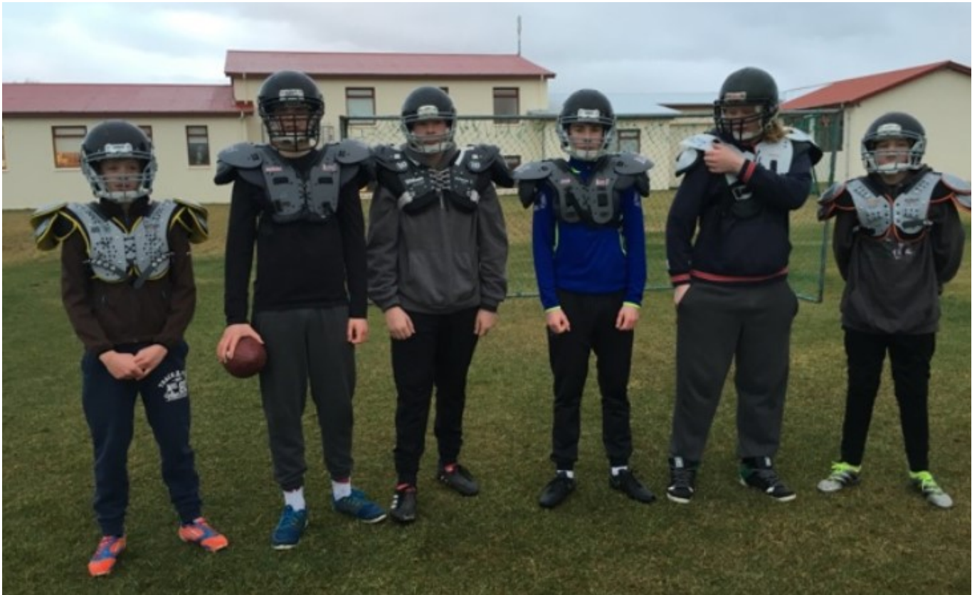
Klárir í ameríska fótboltann