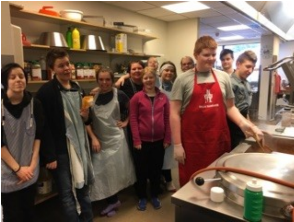
Nemendur í matargerðarlist