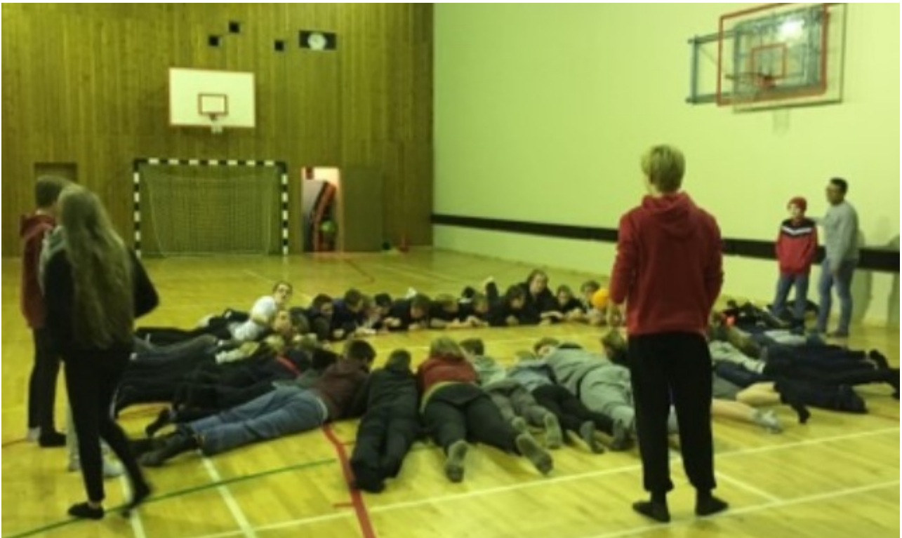
BRUGÐIÐ Á LEIK Í LOK DAGS ÞAR SEM NEMENDUR SJÁ UM SKIPULAG

Hér má sjá lista yfir allar smiðjur sem hafa verið í boði: