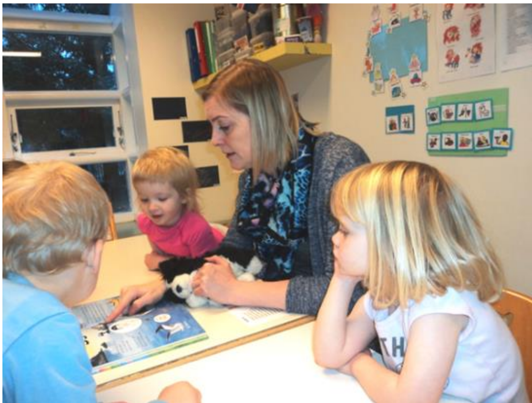
Unnið með læsi í leikskólanum Álheimum