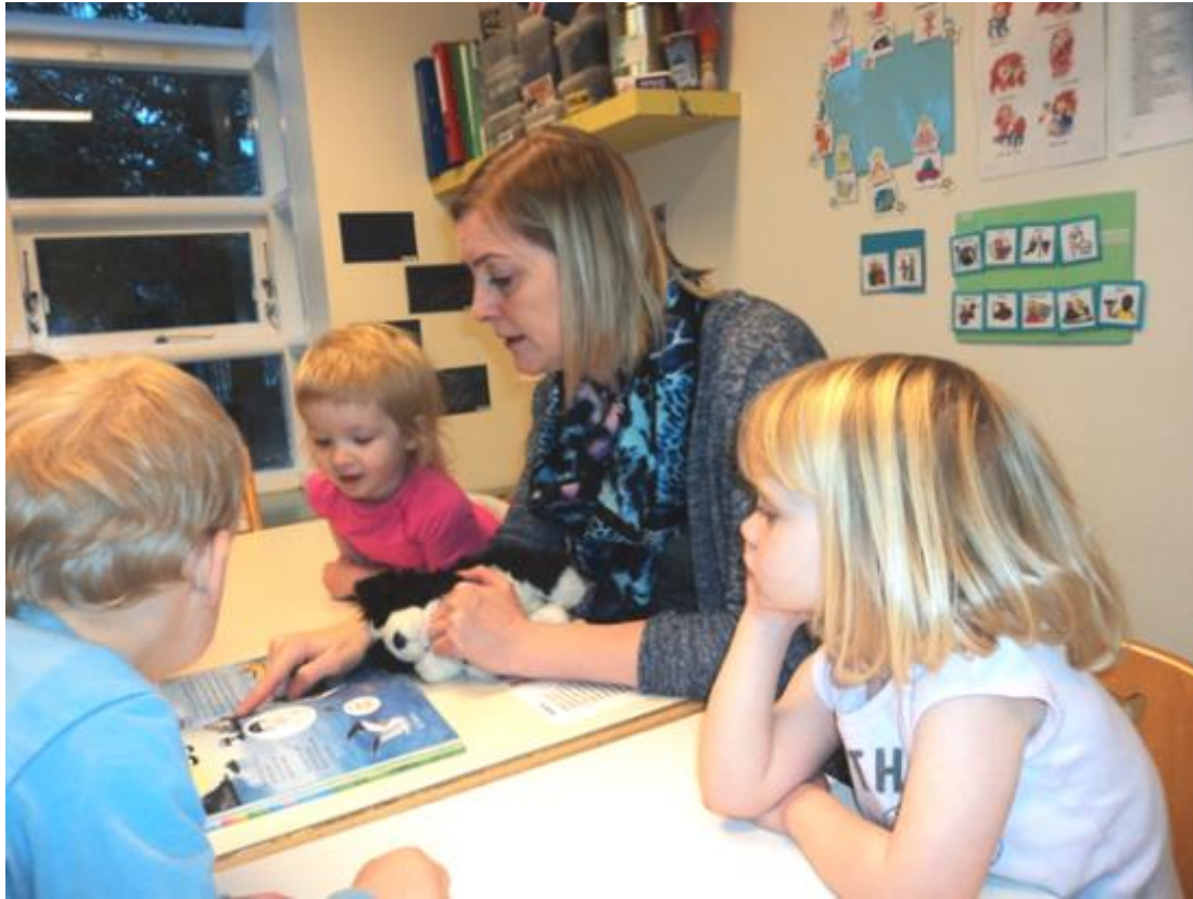
UNNIÐ MEÐ LÆSI Í LEIKSKÓLANUM ÁLFHEIMUM