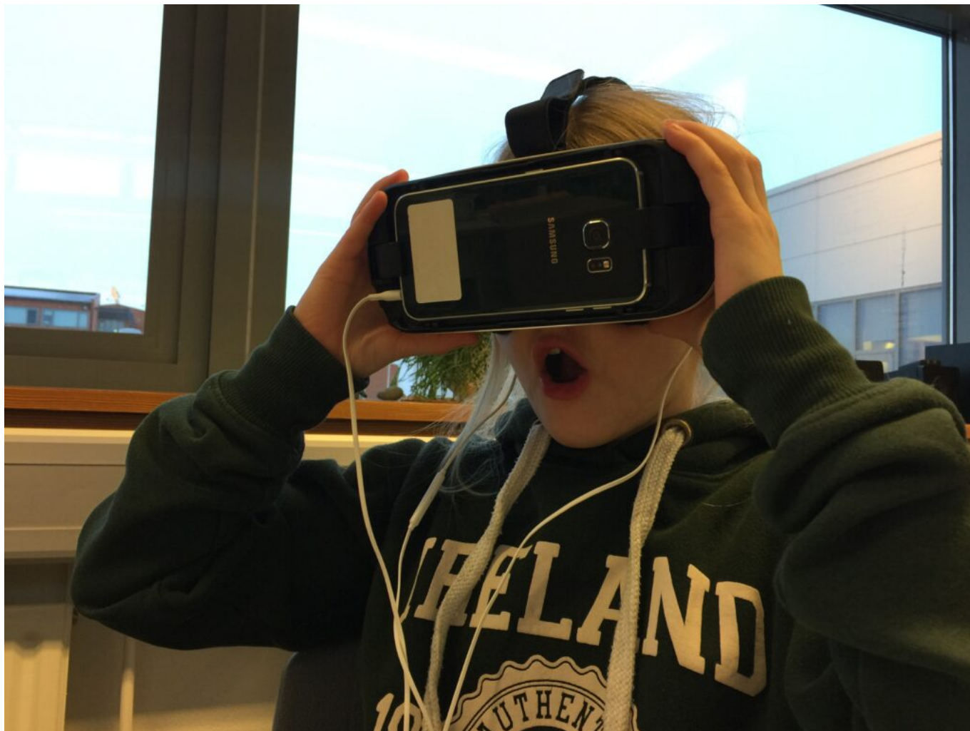
STÚLKA I 4. BEKK PRÓFAR SÝNDARVERULEIKA Í FYRSTA SINN.

Með aukinni tækninotkun og þekkingu aukast möguleikar okkar til þess að breyta kennsluháttum. Þegar við ætlum að kveikja eld í hugum barnanna henta þær kennsluaðferðir sem algengastar eru að mínu mati mjög illa. Að sjálfsögðu skiptir kennarinn og geta hans til þess að vekja áhuga og áhugi hans sjálfs á efninu miklu máli en tæknin skapar marga nýja möguleika.