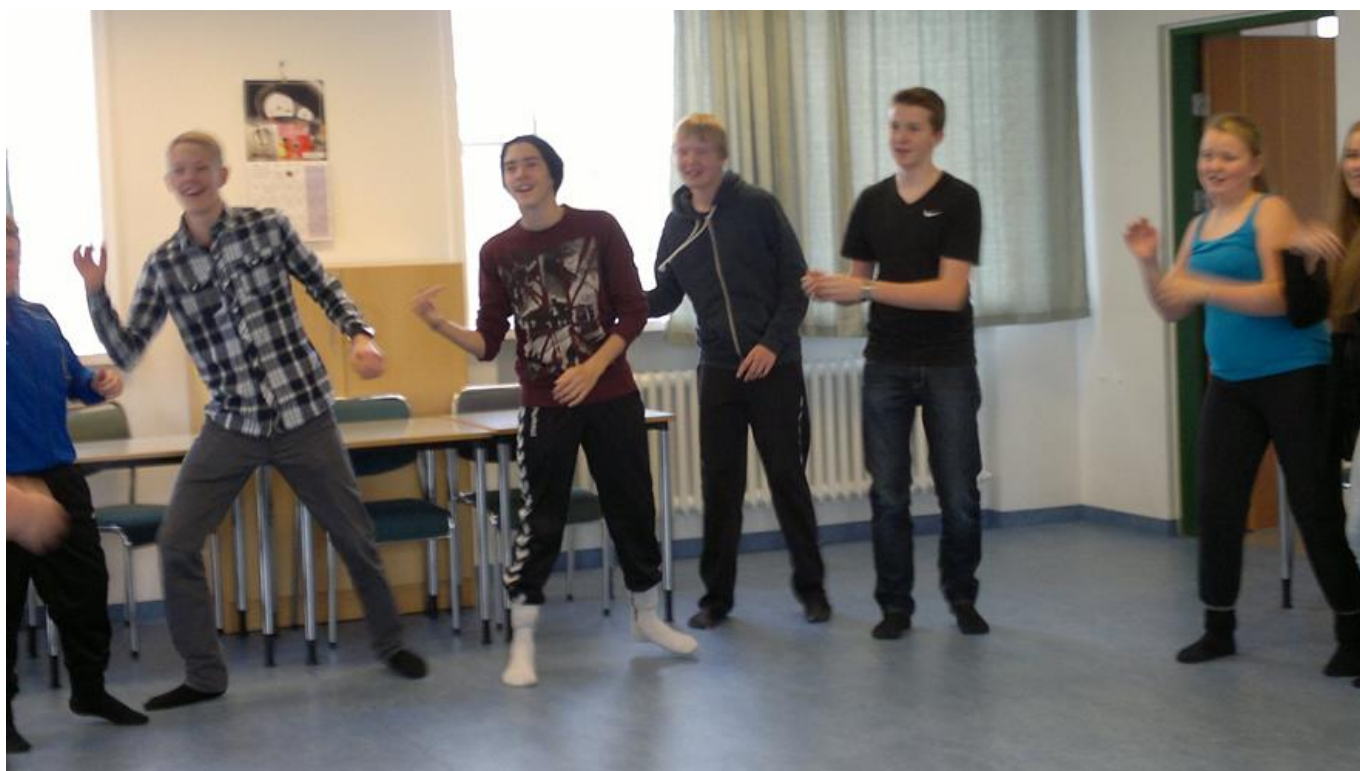
ZUMBADANS UNDIR STJÓRN KENNARA.

Kveikjan er alltaf fyrsti hluti áhugasviðsverkefnisins og byrjar strax og skóli hefst að hausti.