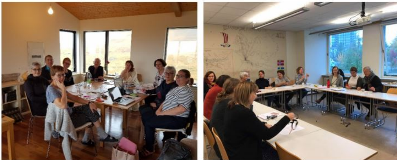
Mynd 4 Fundir starfendarannsóknarhópsins,