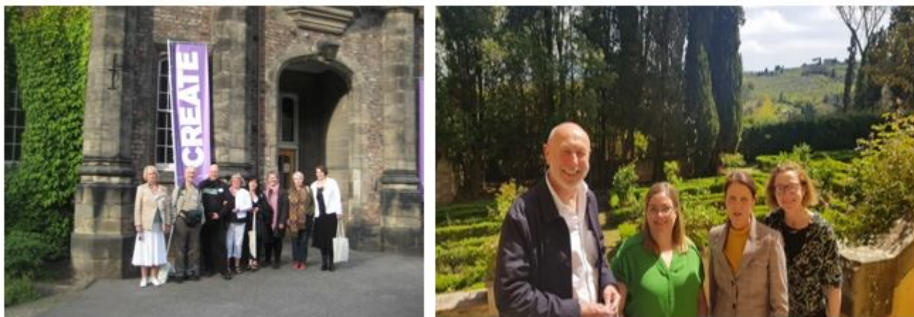
Mynd 6 Myndir úr námsferðum þátttakenda á ráðstefnur um starfendarannsóknir.