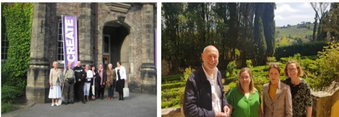
MYND 6 MYNDIR ÚR NÁMSFERÐUM ÞÁTTTAKENDA Á RÁÐSTEFNUR UM STARFENDARANNSÓKNIR.