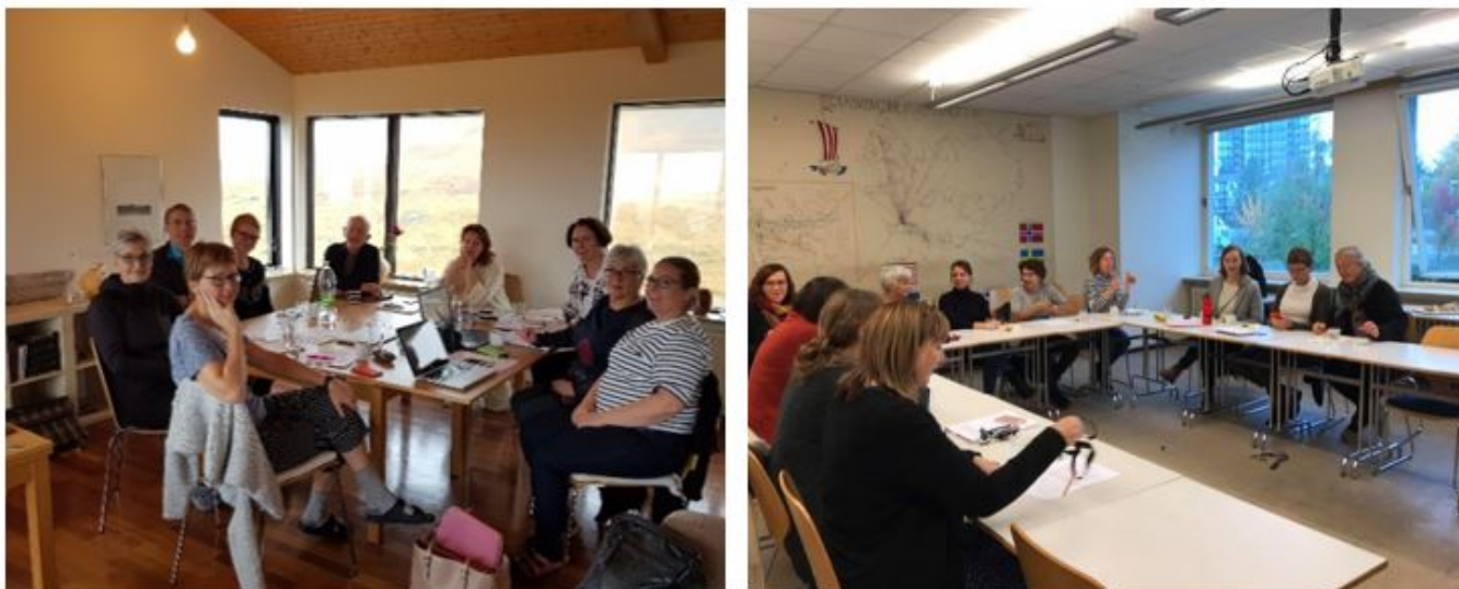
MYND 4 FUNDIR STARFENDARANNSÓKNARHÓPSINS,