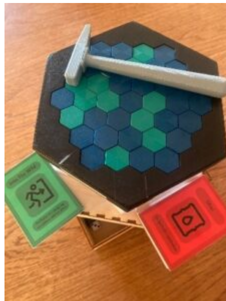
ÓLÍK VERKEFNI KALLA Á NÁMSMAT SEM STYÐUR VIÐ SKÖPUN OG FRUMKVÖÐLAHUGSUN.

Nemendur fá með þessu móti reglulega endurgjöf, í anda leiðsagnarnáms, allan námstímann til að miðla upplýsingum um efni, árangur og frammistöðu sem og að minna á námsmarkmiðin. Lögð er áhersla á að þessi endurgjöf sé jákvæð og uppbyggileg og til þess fallin að auka áhuga nemenda á viðfangsefninu og styrkja sjálfsmynd þeirra. Ekki má gleyma að nefna að í lokaverkefnum reynir mjög mikið á nemendur hvað varðar frumkvæði, hugmyndaauðgi, verkefnastjórn og hópvinnu og þetta eru þættir sem eru ávallt hluti af námsmatinu.