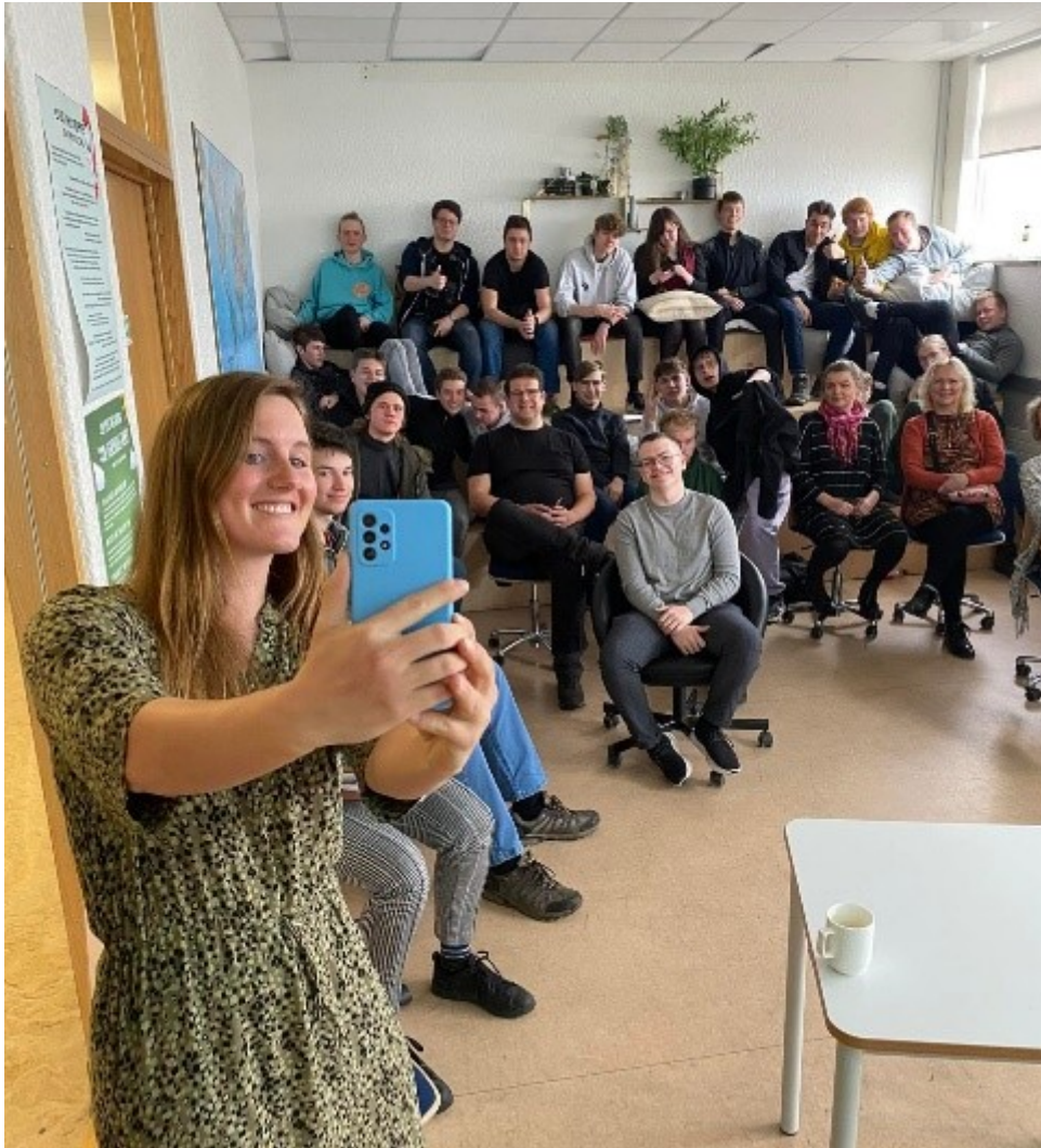
FRÁ VEL HEPPNAÐRI LOKAVERKEFNISSKYNNINGU.