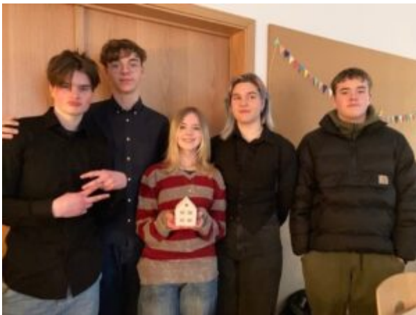
NEMENDUR NJÓTA GÓÐS AF FJÖLBREYTTU OG SANNGJÖRNU NÁMSMATI.

Námsmat lokaverkefna er fjölbreytt og endurspeglar fagmennsku og skapandi kennsluhætti. Það byggir á þeim hæfniviðmiðum sem sett eru fram í hverju námskeiði og í því felst skýr tenging við hugmyndafræðina um árangursríkt og faglegt lærdómssamfélag. Algengt er að námsmat samstandi af eftirfarandi námsmatsliðum: Vali og afmörkun rannsóknarefnis, ítarlegri verkefnislýsingu sem nemendur þróa í kjölfar kynningar á viðfangsefninu, skýrslu um þekkingarfræðilegan bakgrunn, vinnudagbók og afurðinni sem verður til hverju sinni.