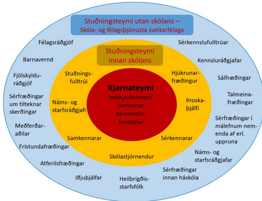
MYND 3. HEILDRÆNIR STARFSHÆTTIR VIÐ STUÐNING VIÐ NEMENDUR (AÐLAGAÐ FRÁ MANITOBA EDUCATION AND ADVANCED LEARNING, 2014).

Í innsta hring líkansins eru nemendur, kennarar og foreldrar í kjarnateymi þar sem athyglin beinist fyrst og fremst að nemandanum. Til að fá heildstæða mynd af þörfum hans og aðstæðum er mikilvægt að kennarar eigi formlegt samtal um þarfir hans og aðstæður. Þeir þurfa einnig að fá upplýsingar um viðhorf og tilfinningar nemenda og foreldra varðandi skólastarfið, námið og samskipti.