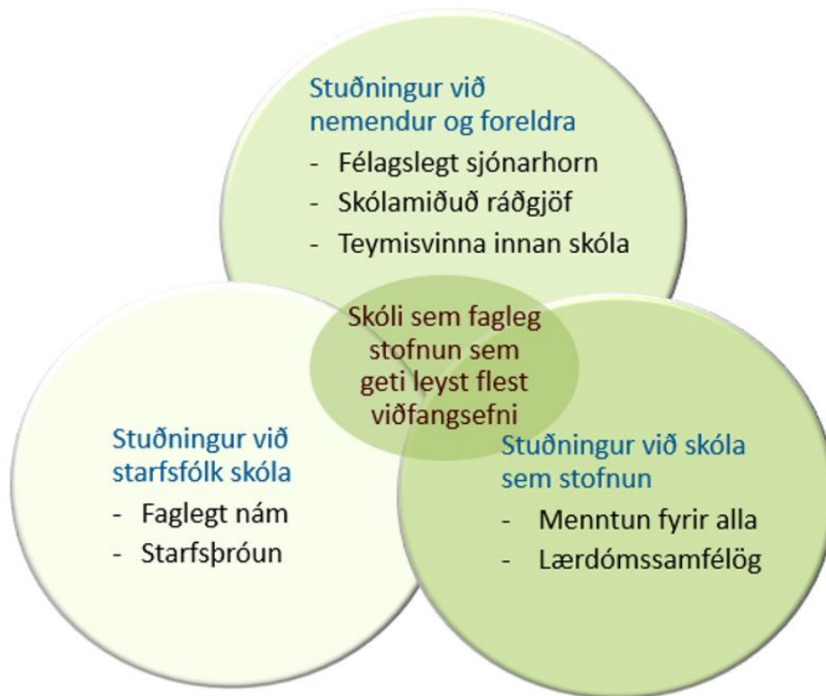
MYND 1. ÞJÓNUSTULÍKAN SKÓLAÞJÓNUSTU.