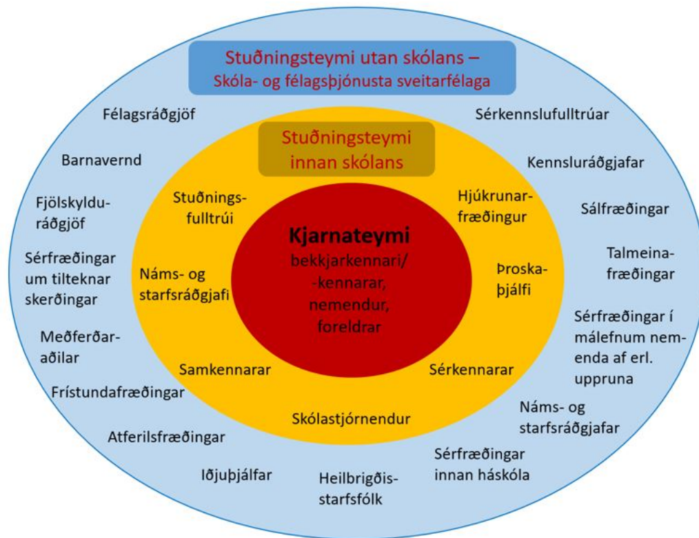
Mynd 3. Heildræni starfshættir við stuðning við nemendur (aðlagð frá Manitoba Education and Advanced Learning, 2014).

Í innsta hring líkansins eru nemendur, kennarar og foreldrar í kjarnateymi þar sem athyglin beinist fyrst og fremst að nemandanum. Til að fá heildstæða mynd af þörfum hans og aðstæðum er mikilvægt að kennarar eigi formlegt samtál um þarfir hans og aðstæður. Þeir þurfa einnig að fá upplýsingar um viðhorf og tilfinningar nemenda og foreldra varðandi skólastarfið, námið og samskipti.