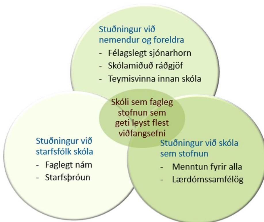
Mynd 1. Þjónustulíkan skólaþjónustu.

um skólaþjónustu sveitarfélaga við leik- og grunnskóla og nemendaverndarráð í grunnskólum nr. 444/2019): 1) stuðning við nemendur og foreldra, 2) stuðning (m.a. kennslufræðilegan) við starfsfólk skóla í daglegum störfum og 3) stuðning við skólann sem stofnun. Mestu varðar að líta á þessi viðfangsefni í heild (sjá mynd 1), þar sem hver þáttur styður annan og að samlegð þeirra miði að því sem reglugerðin um skólaþjónustu (2. grein) kallar „að efla skóla sem faglegar stofnanir sem geti leyst flest þau viðfangsefni sem upp koma í skólastarfi“.