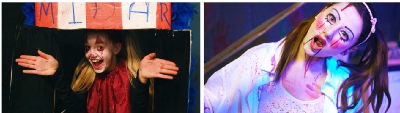
FJÖR Í FJÖRHEIMUM!

Í lok októbermánaðar er Hrekkjavaka og nýttu skólarnir sér þann tíma að hluta til sem uppskeruhátíð Skólaslita. Í öllum skólum var sköpun nemenda í kjölfar sögunnar fjölbreytt og sýnileg, en hver og einn skóli útfærði það á sinn hátt. Félagsmiðstöðin Fjörheimar sá um að undirbúa draugahús í tilefni Hrekkjavökunnar og varð sú vinna lituð af sögunni Skólaslit. Þarna var öllu til tjaldað og ungmenni á vegum Fjörheima höfðu veg og vanda að uppsetningu draugahússins og var magnað að sjá allar þær hugmyndir sem fram komu og voru útfærðar til að skapa stemningu í anda Skólaslita. Þarna fengu frjóar hugmyndir byr undir báða vængi, þær útfærðar og framkvæmdar. Draugahúsið var opið í þrjá daga í kringum Hrekkjavöku í lok október. Húsnæðinu, sem er rúmlega fjögur hundruð fermetrar að stærð, var skipt upp í níu svæði og undirlagt af hrollvekjju og draugagangi þessa daga. Tvær útfærslur voru á draugahúsinu, annars vegar hefðbundin þar sem myrkur var og hugmyndaflugið réði för og hins vegar þar sem ljósín voru kveikt þannig að þeir sem vildu taka þátt gátu komið án þess að dvelja í myrkrinu. Í heildina fóru um tvö þúsund manns á öllum aldri í gegnum draugahúsið þá daga sem það var opið og mikill meirihluti nemenda miðstigs grunnskóla á svæðinu var þar á meðal. Ungmenni í Fjörheimum útbjuggu einnig kynningarmyndbönd fyrir Skólaslit, uppsetningu á kynningarefni og fleira.