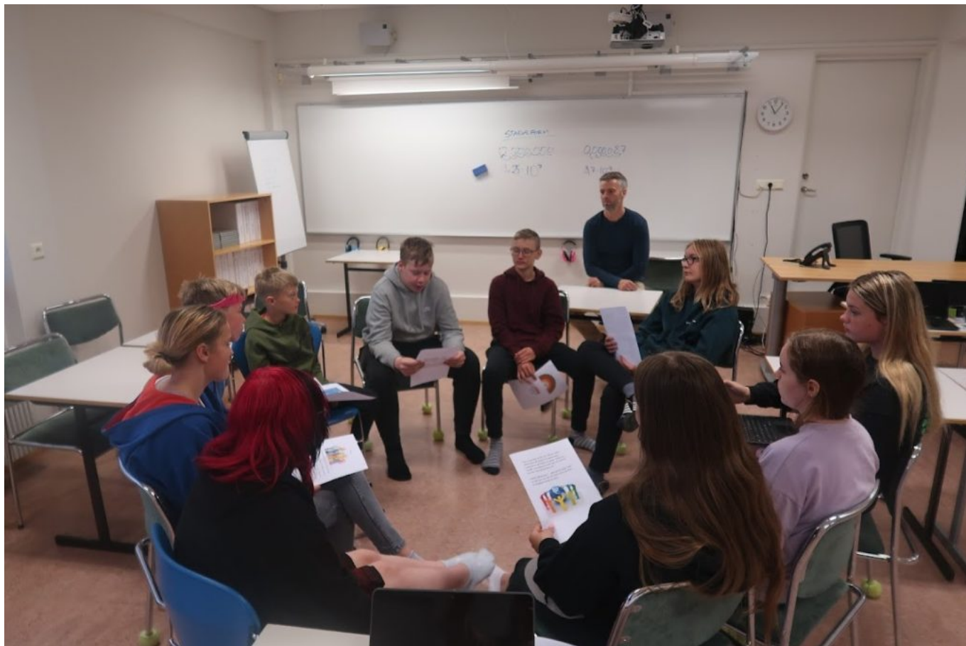
Mynd 4 - Í upphafi fór fram hugtakavinna þar sem nemendur gerðust sérfræðingar í ákveðnum hugtökum og deildu svo þekkingu sinni með öðrum. Hugtökin sem nemendur unnu með og ræddu í umræðuhópum voru m.a. samfélag, stjórnskipulag, menning, velferðarkerfi, menntakerfi, innviðir og umhverfismál. Þúsílaðferðin tókst mjög vel og nemendur nýttu sér þessi hugtök alla önnina.