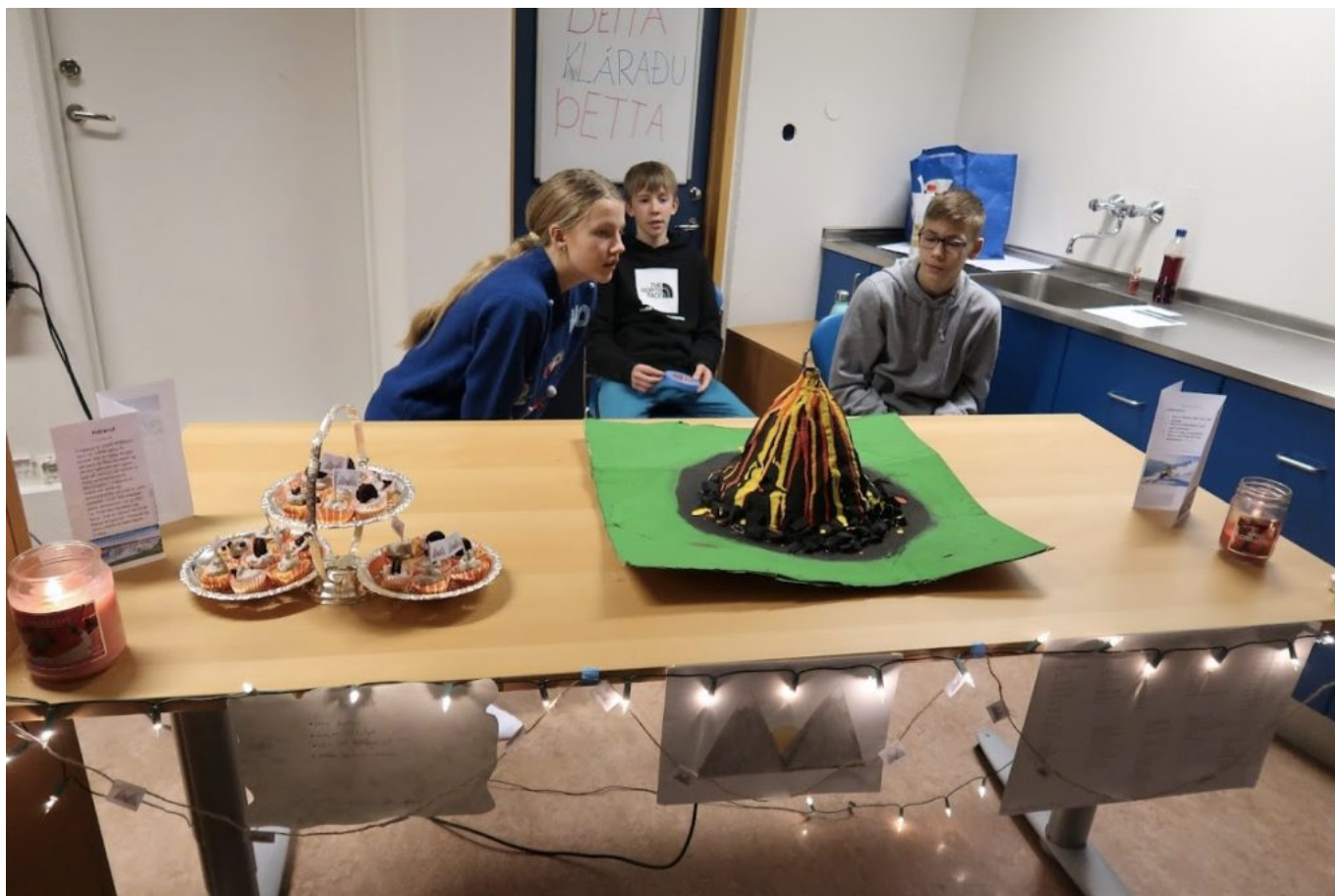
Mynd 8 - Stoltir nemendur kynna landið sitt. Þar var meðal annars eldfjall sem nemendur létu gjósa á kynningunni.

Fyrir utan markmið lykilhæfni voru markmið okkar í kennarateyminu að búa til skapandi og glaðlegt námsumhverfi og stuðla að góðum og jákvæðum samskiptum. Við vildum einnig efla jákvæða leiðtoga og námsgleði skipti okkur miklu máli. Varðandi samstarf okkar þá höfum við unnið lengi saman og vildum í raun meiri samvinnu. Við festum tíma í hverri viku þar sem við undirbyggjum næstu tíma - eða unnum í námsmati og ræddum síðasta tíma. Við vildum hrísta upp í eigin starfsháttum og ögra sjálfum okkur með nýjum nálgunum.