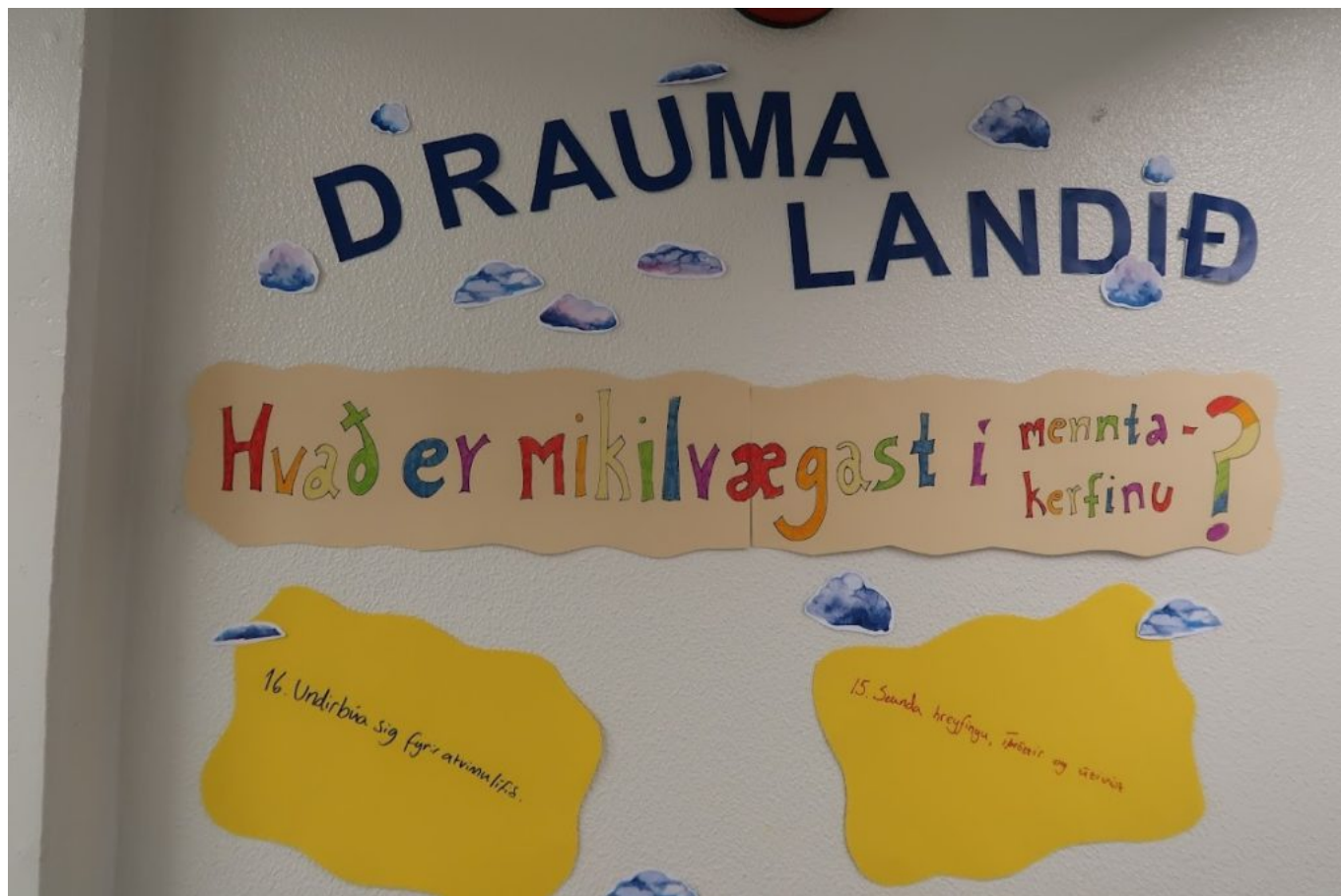
MYND 6 - NIÐURSTÖÐUR ÚR NEMENDASTÝRÐUM UMRÆÐUM UM HVAD SÉ MIKILVÆGAST Í MENNTAKERFINU. HJÁ HLUTA NEMENDA VAR SÚ SKOÐUN RÍKJANDI AÐ TILGANGUR MENNTAKERFIS VÆRI AÐ UNDIRBÚA NEMENDUR UNDIR ATVINNULÍFIÐ EN AÐRIR TÖLDU AÐ MARKMIÐIÐ HLYTI AÐ VERA AÐ NEMENDUR YRÐU HAMINGJUSAMIR.

Áhugavert var að skoða markmið lykilhæfni með hliðsjón af þessum verkefnum. Það var svo margt sem hver hópur þurfti að taka afstöðu til og sammælast um - og margir lentu í talsverðum átökum. En það er nú þannig að enginn fæðist fullnuma í samskiptum og mistök eru ómetanleg tækifæri til þess að læra, það vitum við fullorðna fólkið. Við ræddum opinskátt um samskiptavanda og málamiðlanir og reyndum að leiða hópa sem lentu í vandræðum áfram að lausn en leystum ekki málin fyrir nemendur.