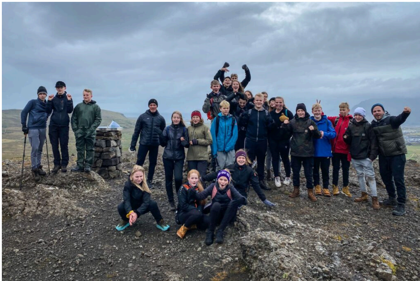
Á toppnum á Reykjafjalli, Reykjaborginni.

Kristján Sturla Bjarnason er tónlistarmaður, tónskáld og grunnskólakennari við Árbæjarskóla. Kristján lauk kennaranámi haustið 2020 með samfélagsfræði sem aðalgrein. Lokaverkefni hans í meistaranáminu bar heitið Gildi þess að efla félags- og tilfinningahæfni nemenda (SEL) fyrir skólastarf á Íslandi . Kristján er með B.Sc í sálfræði og hefur unnið með unglingum um nokkurra ára skeið. Kristján er óhræddur við að fara ótroðnar slóðir í kennslunni þar sem áhersla hans er á eflingu félagsfærni nemenda.