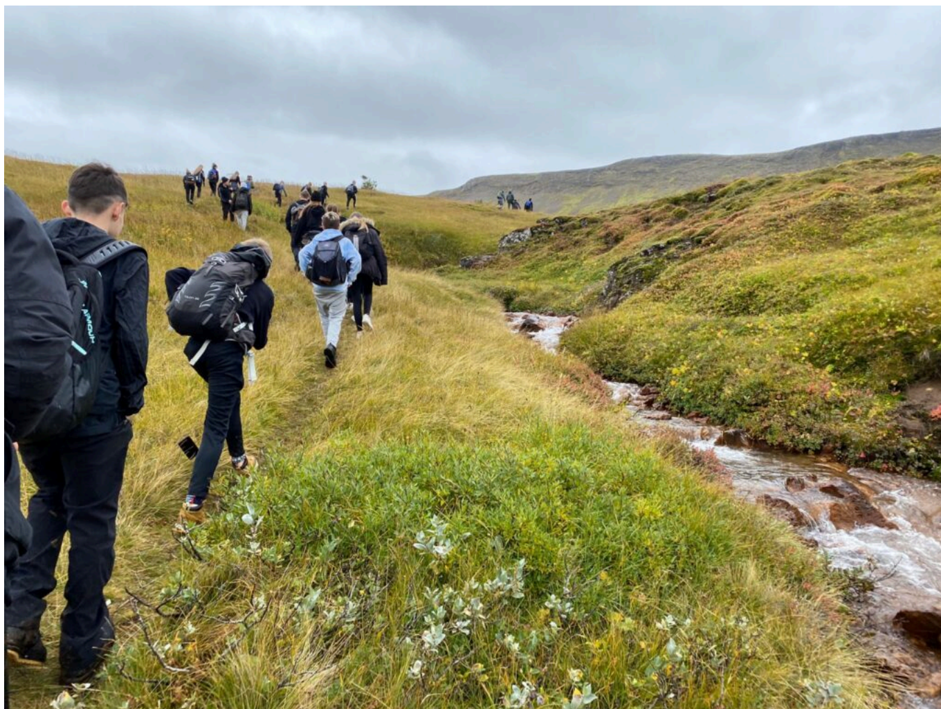
Gengið á Reykjafjall í Mosfellsbæ með Þverfellið í auglýsýn.

Það sem gerir skólastarf skemmtilegt er ekki síst sú staðreynd að við höfum val um hvernig við nálgumst viðfangsefnin með nemendum. Aðalnámsskrá grunnskóla stoppar okkur ekki af í að nálgast þau á fjölbreyttan og nýstárlegan hátt heldur frekar vanafesta okkar og takmarkandi hugur. Við virðumst á stundum eiga auðveldara með að finna ástæður fyrir að framkvæma ekki hugmyndir okkar og sjá hindranir í öllum hornum í stað þess að leyfa okkur að hugsa „hvað ef ...“ því með réttu hugarfari eru okkur allir vegir færir!