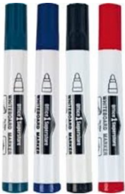
MYND 3. TÚSSPENNAR Í ÓLÍKUM LITUM.

Mikilvægt er að skilgreina hlutverkin eftir eðli verkefna. Þekkt hlutverk eru: Talsmaður, ritari, umræðustjóri, tímavörður, gagnastjóri og „gúggleri“. Hafa ber í huga að þessi hefðbundnu hlutverk geta styrkt ákveðið valdaójafnvægi í hópastarfi. Í markvissri vinnu með félögum mínum hjá Evrópuráðinu höfum við þróað eftirfarandi hlutverk og aðferð sem ætlað er að vinna gegn slíku ójafnvægi: