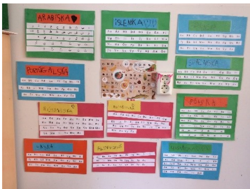
TÖFRANDI TUNGUMÁL - LEIKSKÓLINN MIÐBORG.