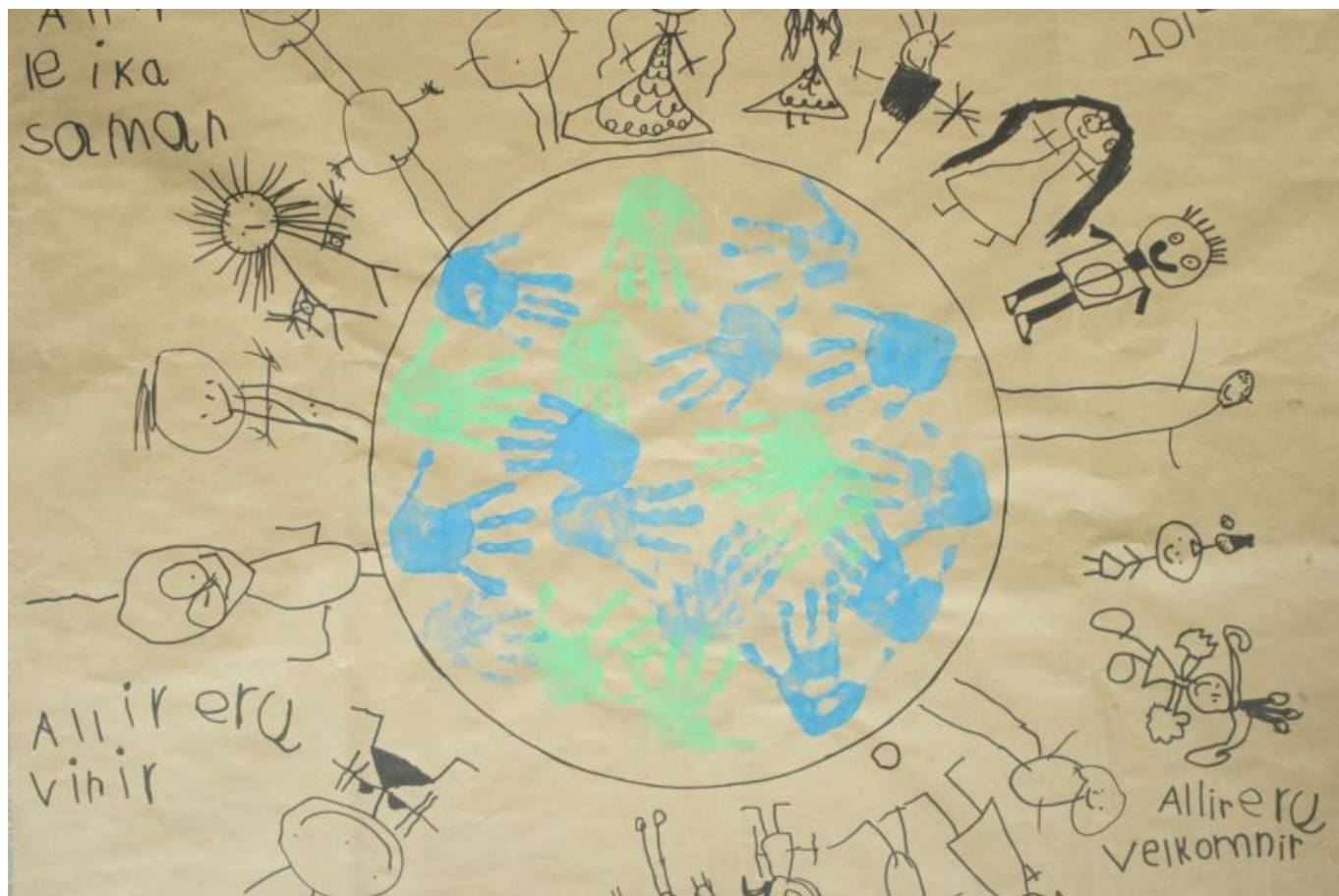
VERK EFTIR BÖRN Í LEIKSKÓLANUM HÓLABORG UNNIÐ Í TENGLUM VIÐ VERKEFNIÐ „VELKOMIN Í LEIKSKÓLANN MINN“ Á BARNAMENNINGARHÁTÍÐ 2017.

fornsagnahandrit. Hún sagðist lítið vita um Ísland nema þekkja tónlist Bjarkar en oft hefði fólk orð á því að hún væri lík Björk í útliti, ég gat staðfest það.