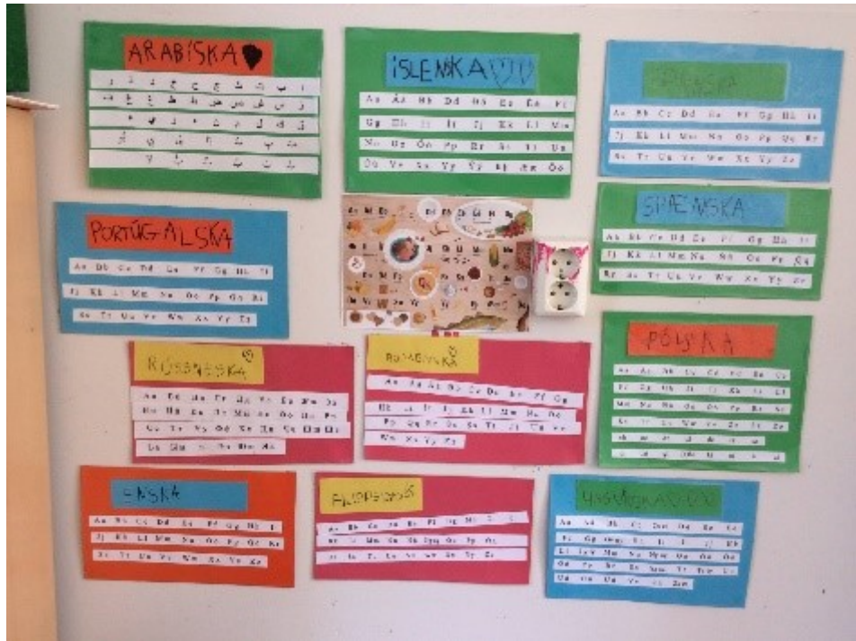
TÖFRANDI TUNGUMÁL - LEIKSKÓLINN MIÐBORG.