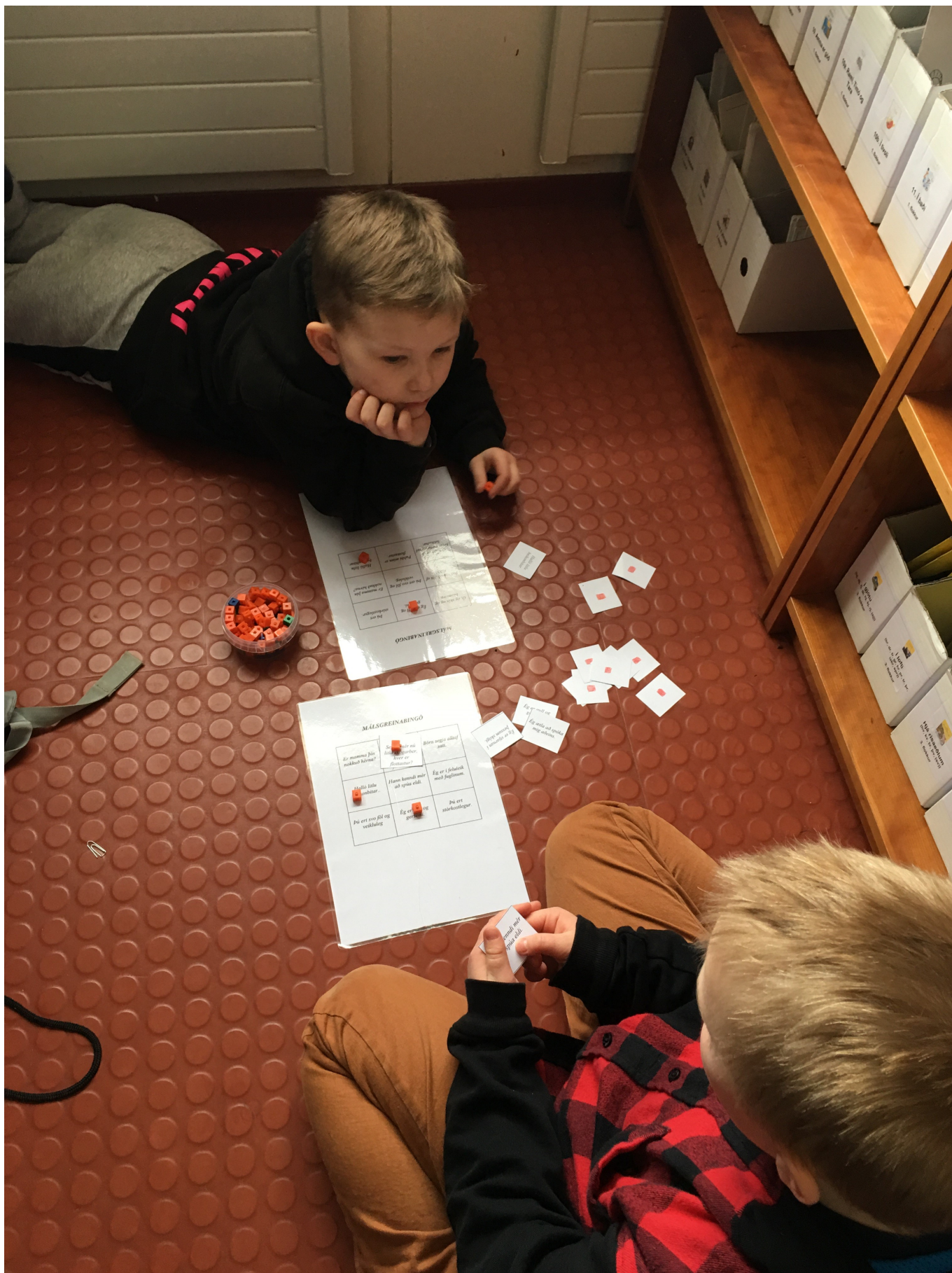
Mynd 8 - Stöð 4 Bingó