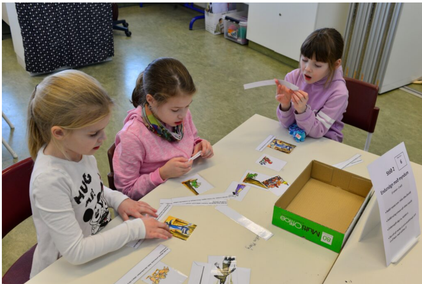
Mynd 6 - Stöð 2 Endursögn með myndum og málsgreinum úr sögunni