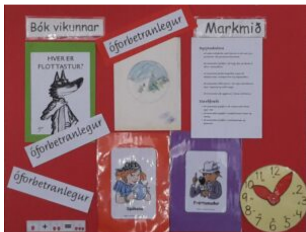
Mynd 1 - Bókin og helstu markmið.