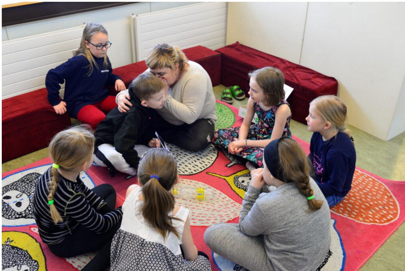
Mynd 7 -Stöð 3 Flöskustútur. Kennarastýrð stöð