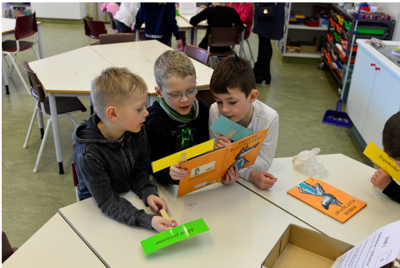
Mynd 5 - Stöð 1 Upplestur - leiklestur