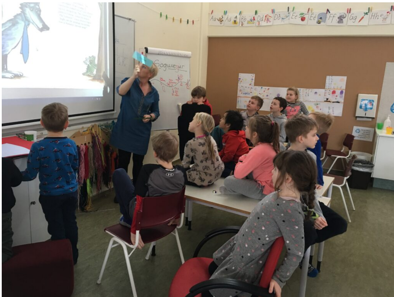
Mynd 2 - Kórlestur - leiklestur