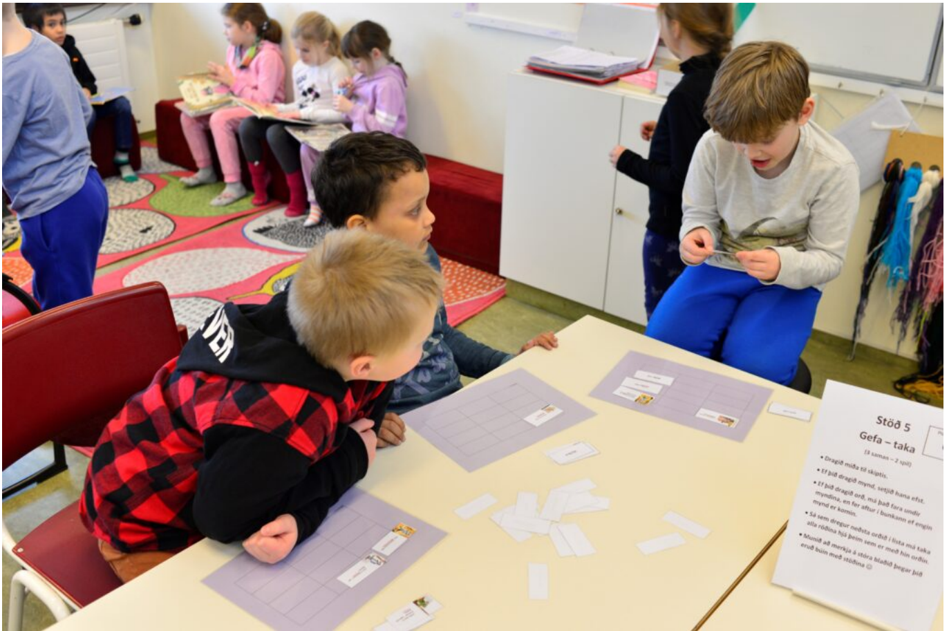
Mynd 9 - Stöð 5 Gefa og taka

5. Gefa og taka : Námsspil þar sem nemendur gáfu hver öðrum eða tóku spjöld þar sem orð eru pöruð við réttar myndir á leikborði.