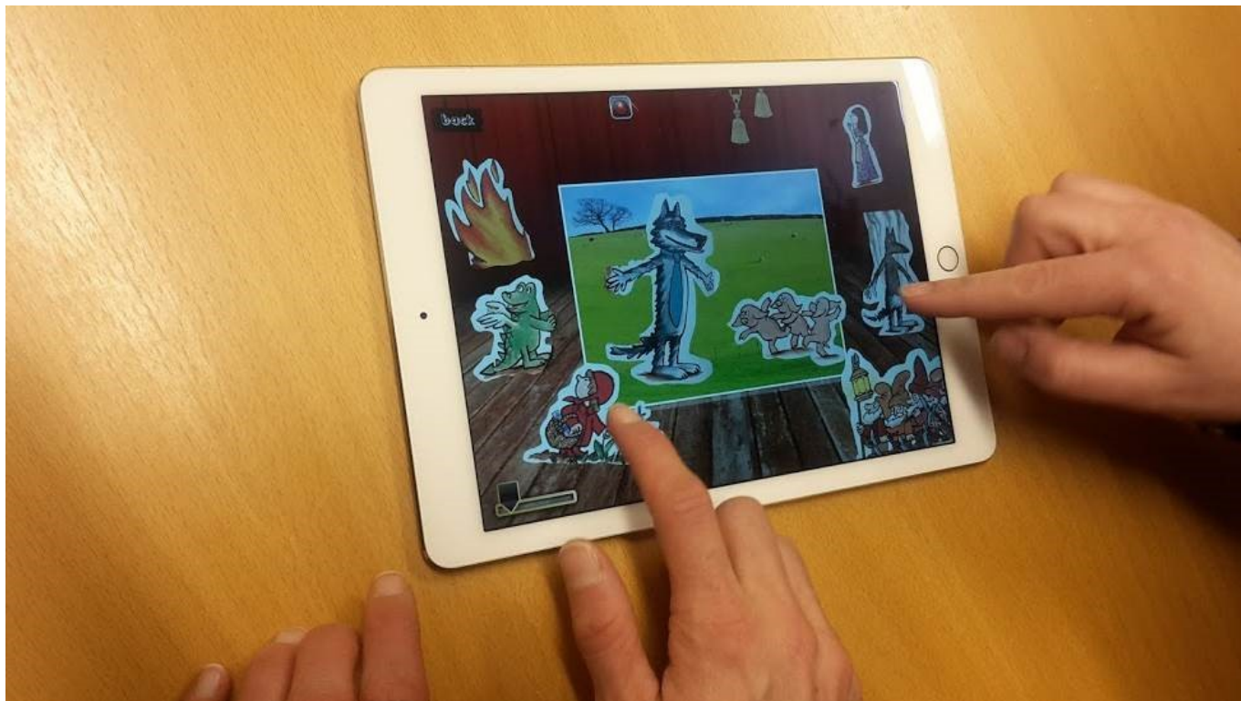
Mynd 13 - Stöð 9 Sögugerð í Puppet Pals