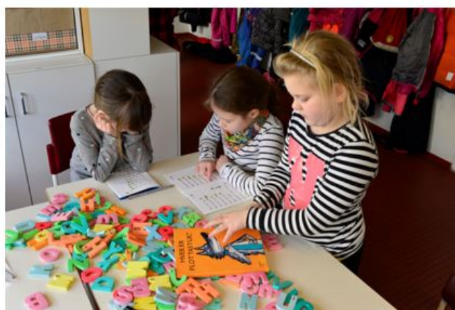
Myndir 3 og 4 - Vinna með lykilorð

Næst settu kennarar upp níu samhliða námsstöðvar með fjölbreyttum viðfangsefnum þar sem efniviðurinn var sóttur í orðaforða sögunnar. Nemendur eru vanir þessum vinnubrögðum og gátu valið í hvaða röð þeir unnu verkefnin og með hverjum þeir unnu. Á hverri námsstöð voru fyrirmæli um vinnulag og hve margir gætu verið á stöðinni í einu. Viðfangsefnin voru: