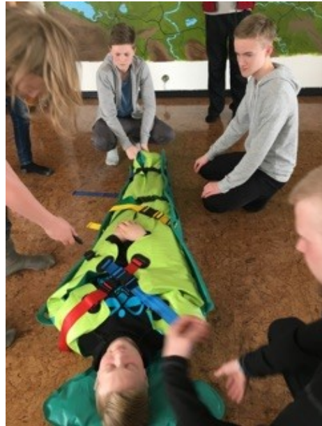
Nemendur kynna nýrri gerð af sjúkrabörum

Það er alltaf spennu fyrir smiðjunum og virkilega gaman að fylgjast með áhuga nemenda, sem og þeirra sem taka að sér að sjá um smiðjurnar hverju sinni. Það má segja að sjá megi nemendur blómstra í verkefnum sínum. Þeir gleyma stund og stað þar sem tímarammi venjubundinna kennslustunda gleymist algerlega.