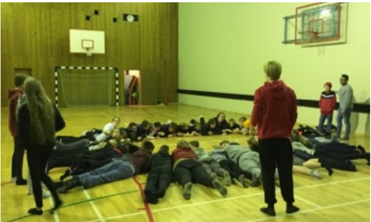
BRUGÐIÐ Á LEIK Í LOK DAGS ÞAR SEM NEMENDUR SJÁ UM SKIPULAG

Hér má sjá lista yfir allar smiðjur sem hafa verið í boði: