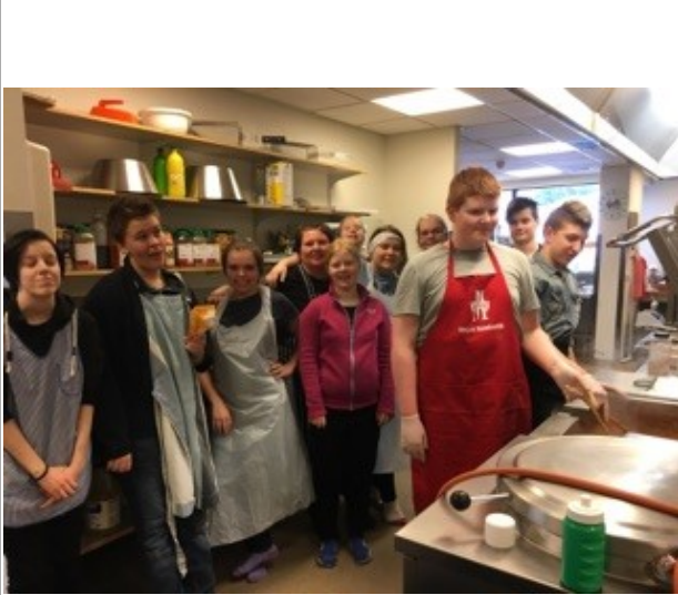
Nemendur í matargerðarlist