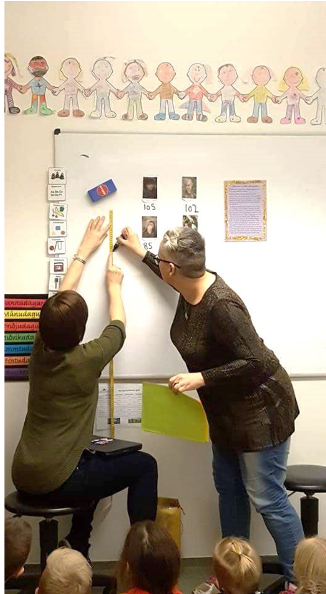
KENNARARNIR MÆLA OG SÝNA HÆÐ ÁLFANNA.

Álfarnir eru hjá okkur af góðum vilja, þeir vilja að það sé gengið vel um og öllum í skólanum sé sýnd virðing. Við í 1. bekk í Naustaskóla leggjum okkur fram við að halda þeim hjá okkur. Kastalinn verður áfram á svæðinu okkar og er fullkominn lestrarkrókur. Það er sannfæring okkar að allt þetta hefði ekki orðið svona skemmtilegt ef við hefðum ekki þorað að taka þennan pappakassa inn til okkar og ákveðið að stíga svolítið út fyrir rammann og bæta við og breyta áætlunum og skipulagi. Nú eigum við þennan frábæra lestrarkrók og griðastað sem við bjuggum til í sameiningu og þar búa nú fjórir álfar; Hera, Himnadsís, Hreggviður og Heimdallur. Við getum alveg búið með þá hjá okkur, í sátt og samlyndi, því kannski eru álfar eftir allt bara menn ... eða menn kannski hálfgerðir álfar? Það skiptir svo sem engu hvað eða hverjir við erum, allir hafa sama rétt til lífs og skoðana. Við erum í það minnsta mjög stolt af vinnunni okkar og hvetjum alla til að leyfa sér að vera börn eins lengi og hægt er, því það er bara svo skemmtilegt.