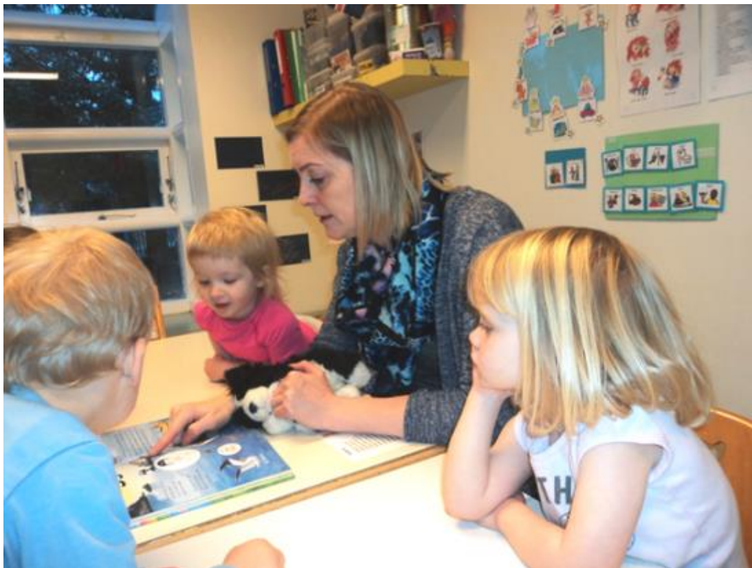
UNNIÐ MEÐ LÆSI Í LEIKSKÓLANUM ÁLFHEIMUM