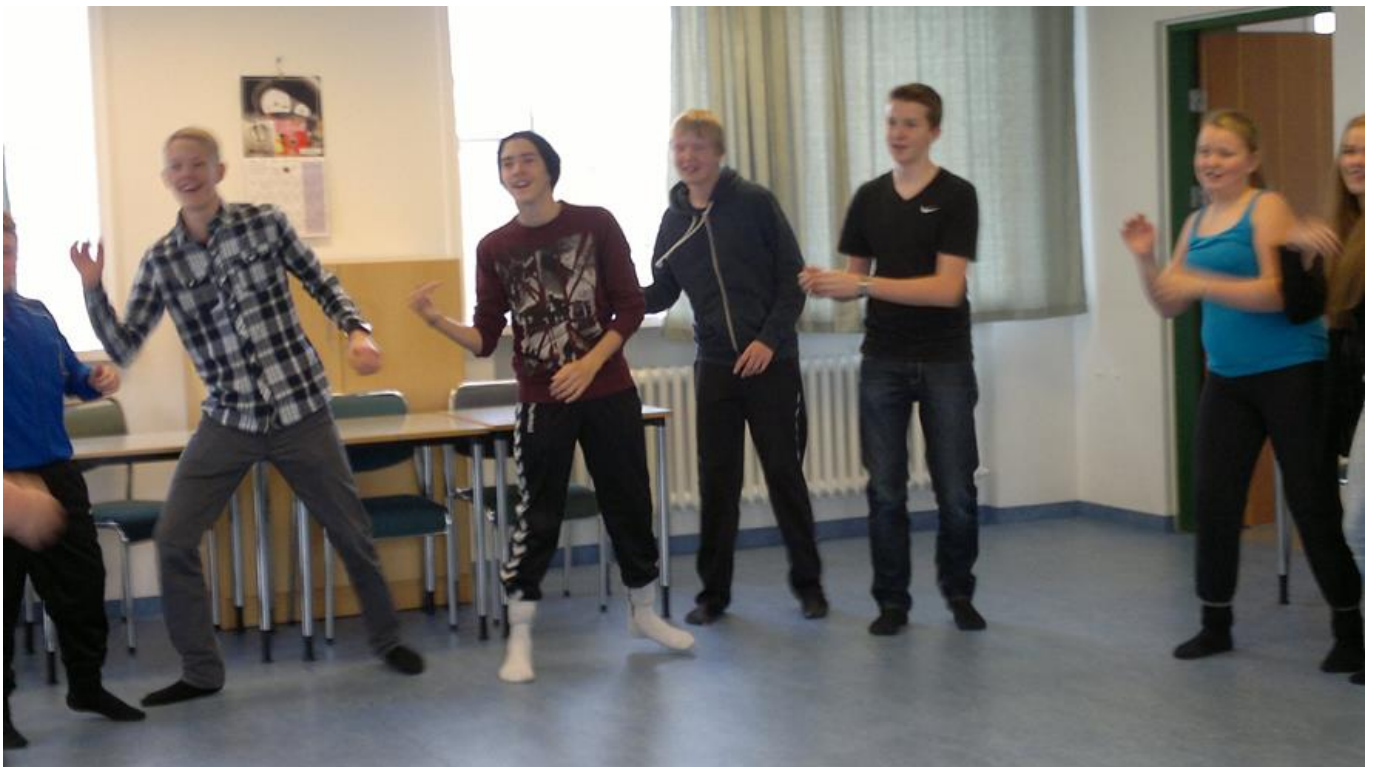
ZUMBADANS UNDIR STJÓRN KENNARA.

Kveikjan er alltaf fyrsti hluti áhugasviðsverkefnisins og byrjar strax og skóli hefst að hausti.