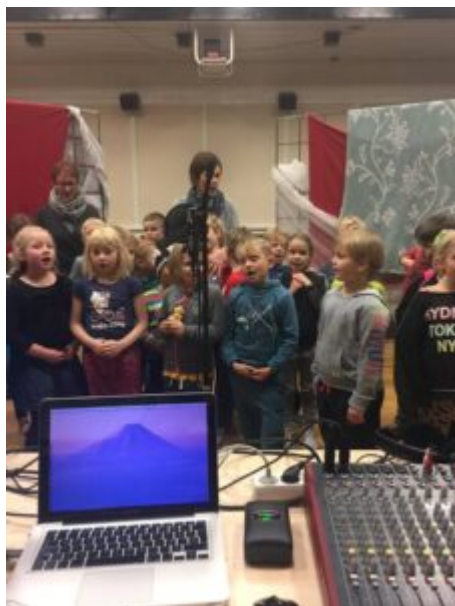
NEMENDUR Í 3. BEKK VIÐ UPPTÖKUR.

loftinu meðal nemenda á meðan þátturinn þeirra er sendur út, bekkurinn hlustar saman og enginn má missa af því að hlusta á sjálfan sig og bekkjarfélagana tala eða syngja í útvarpið.