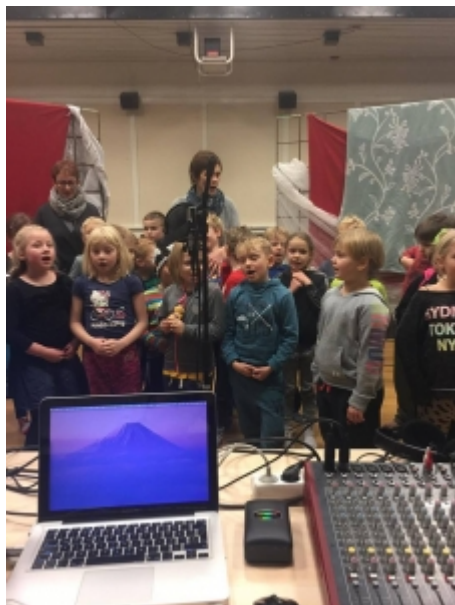
NEMENDUR Í 3. BEKK VIÐ UPPTÖKUR.

tekur undirbúningur jólaúthvarpsins þrjár til fjórar vikur. Nemendur yngri bekkja gera sameiginlegan bekkjarþátt og fær hver bekkur úthlutað einum klukkutíma til útsendingar. Þátturinn er hljóðritaður fyrirfram og vinna nemendur undir styrkri leiðsögn kennara sinna sem leggja á sig töluverða vinnu við undirbúninginn. Hér er um fjölbreytta þætti að ræða sem byggjast upp á töluðu máli og söng. Það er alltaf ákveðin eftirvænting og spennan í loftinu meðal nemenda á meðan þátturinn þeirra er sendur út, bekkurinn hlustar saman og enginn má missa af því að hlusta á sjálfan sig og bekkjarfélagana tala eða syngja í útvarpið.