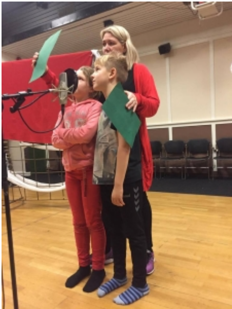
NEMENDUR Í 4. BEKK TAKA UPP EFNI.

Hitann og þungann af vinnu við undirbúning og útsendingar útvarpsins ber stjórn Nemendafélags Grunnskólans í Borgarnesi ásamt tæknimönnum sem sjá um tæknimál, bæði við upptöku þátta yngri bekkja og í beinni útsendingu þátta eldri nemenda. Það krefst mikillar vinnu og leggja krakkarnir nótt við dag til þess að láta allt ganga upp. Ekki er hægt að segja annað en að mikið og fjölbreytt nám fari fram við framkvæmd þessa verkefnis, nám fyrir tæknimenn, nám í íslensku, handritsgerð og framsögn og þjálfun í að koma fram. Auk þess sem hér er um mjög skemmtilegt verkefni að ræða sem setur sterkan svip á bæjarlífið og jólaundirbúninginn.