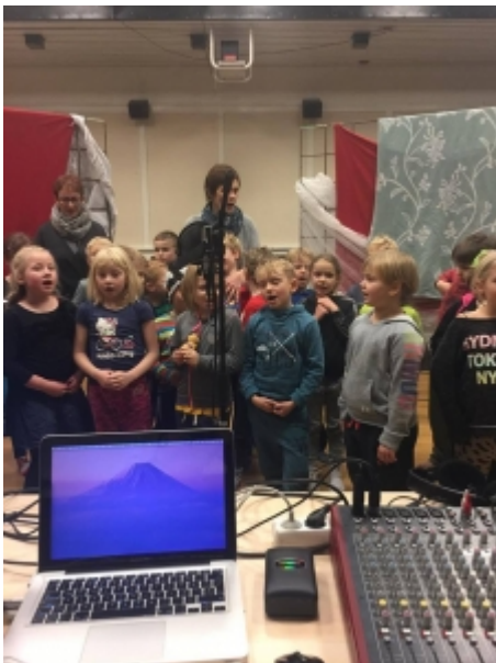
NEMENDUR Í 3. BEKK VIÐ UPPTÖKUR.

Í Grunnskólanum í Borgarnesi eru allir nemendur skólans þátttakendur í verkefninu og tekur undirbúningur jólaútvarpsins þrjár til fjórar vikur. Nemendur yngri bekkja gera sameiginlegan bekkjarþátt og fær hver bekkur úthlutað einum klukkutíma til útsendingar. Þátturinn er hljóðritaður fyrirfram og vinna nemendur undir styrkri leiðsögn kennara sinna sem leggja á sig töluverða vinnu við undirbúninginn. Hér er um fjölbreytta þætti að ræða sem byggjast upp á töluðu máli og söng. Það er alltaf ákveðin eftirvænting og spennan í loftinu meðal nemenda á meðan þátturinn þeirra er sendur út, bekkurinn hlustar saman og enginn má missa af því að hlusta á sjálfan sig og bekkjarfélagana tala eða syngja í útvarpið.